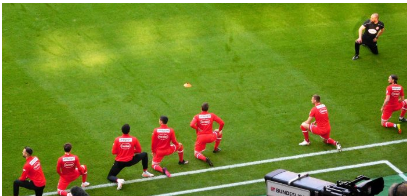
F95 vs St. Pauli: Aufwärmen vor Bundesliga-Kameras