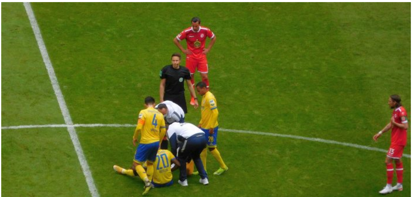
F95 vs BTSV: Verletzung oder Schauspielkunst?

Mittelstürmer. Vielleicht ist es (theoretisch) die beste Idee, das ganz Offensivspiel der Fortuna mehr vertikal anzulegen als in die Breite zu gehen. Da hätten wir dann schon drei junge Burschen, die mit einer solchen Anlage was anfangen können: Appelkamp, Iyoha und Kownacki.