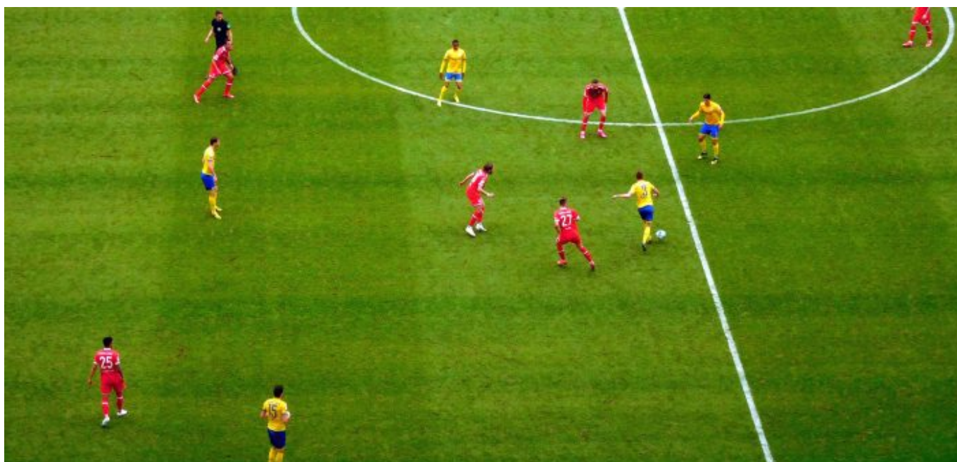
F95 vs BTSV: Im Prinzip gutes Verengen im Mittelfeld