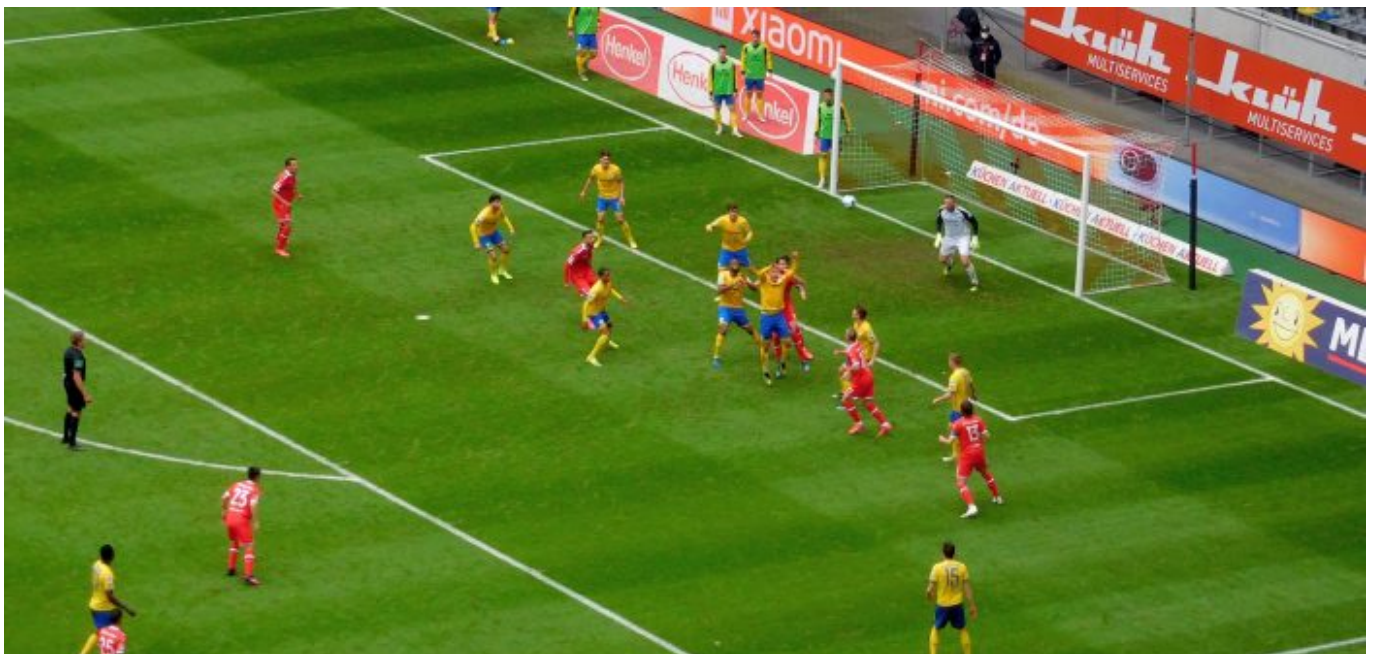
F95 vs BTSV: Brotlose Strafraumszene gegen Ende

Jahn Regensburg hinstellen und zu Beginn der Spielzeit sagen: Ähem, wir wollen dieses Jahr in die erste Liga aufsteigen. Wenn du aber mit demselben Kader und Trainerteam antrittst, wirst du nur belustigtes Gepruste allerorten ernten. Theoretisch war es natürlich richtig, dass Kläuschen Allofs (ja, wir wissen jetzt, dass es seine ureigene Idee war) als Sportsprecher eines Erstligaabsteigers das Saisonziel „direkter Wiederaufstieg“ ausgab, denn so machen Absteiger das eben (auch Schalke + X werden das demnächst so machen). Nur wäre es in der Praxis klug, vorher die Rahmenbedingungen, also die Möglichkeiten und Fähigkeiten ein bisschen genauer unter die Lupe zu nehmen.