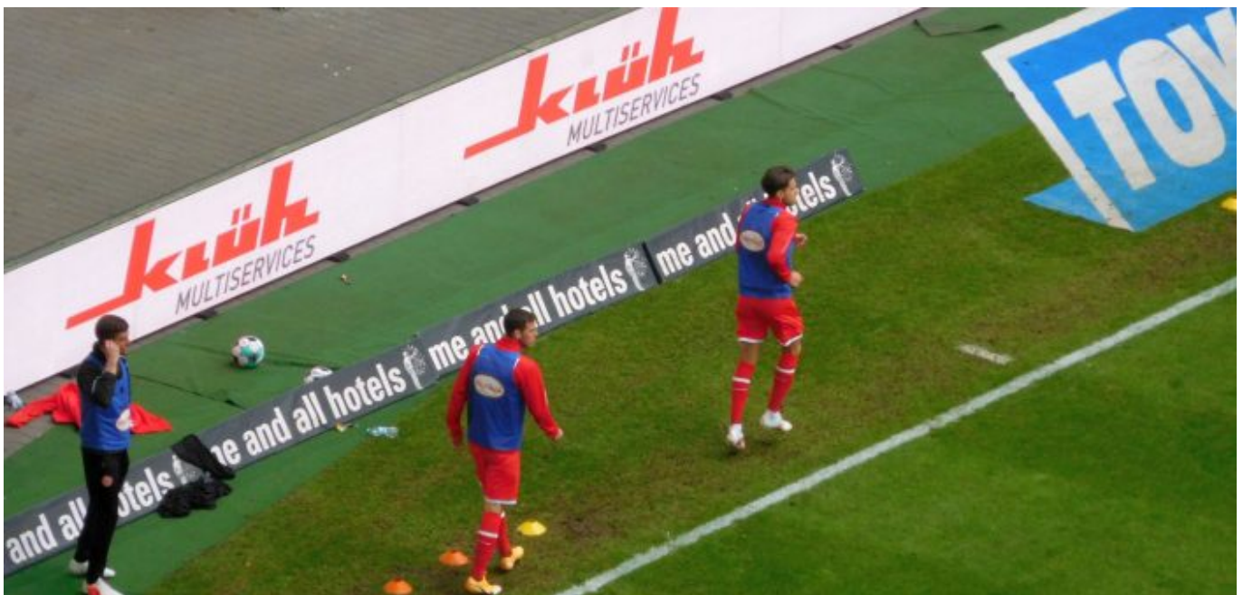
F95 vs BTSV: Die letzten verbleibenden Auswechselspieler

Nun waren ja noch mehr als zwanzig Minuten zu spielen, und Fortuna hatte noch nicht ausgewechselt. Wobei die Herren Hennings, Borrello und Iyoha schon vor dem Ausgleich zum Umziehen an die Bank gekommen waren. Natürlich roch das nach KSC, aber man sollte Trainer Rösler nicht für so bescheuert halten, dass er mit denselben Tauschereien zweimal zum Wechselmagier werden könnte. Zumal ja mit Karaman einer in der Startelf stand, der am Montag noch zu den Eingewechselten zählte. Bevor die drei(!) Stürmer kamen, hämmerte Klaus in der 74. Minute ein Pfund aus etwas mehr als zwanzig Metern unter die BTSV-Latte – das hätte problemlos auch das 3:2 werden können. Wie würde es eine dieser neumodischen Sprechpuppen in dümmstem Denglish ausdrücken? Noch eine Viertelstunde „zu gehen“.