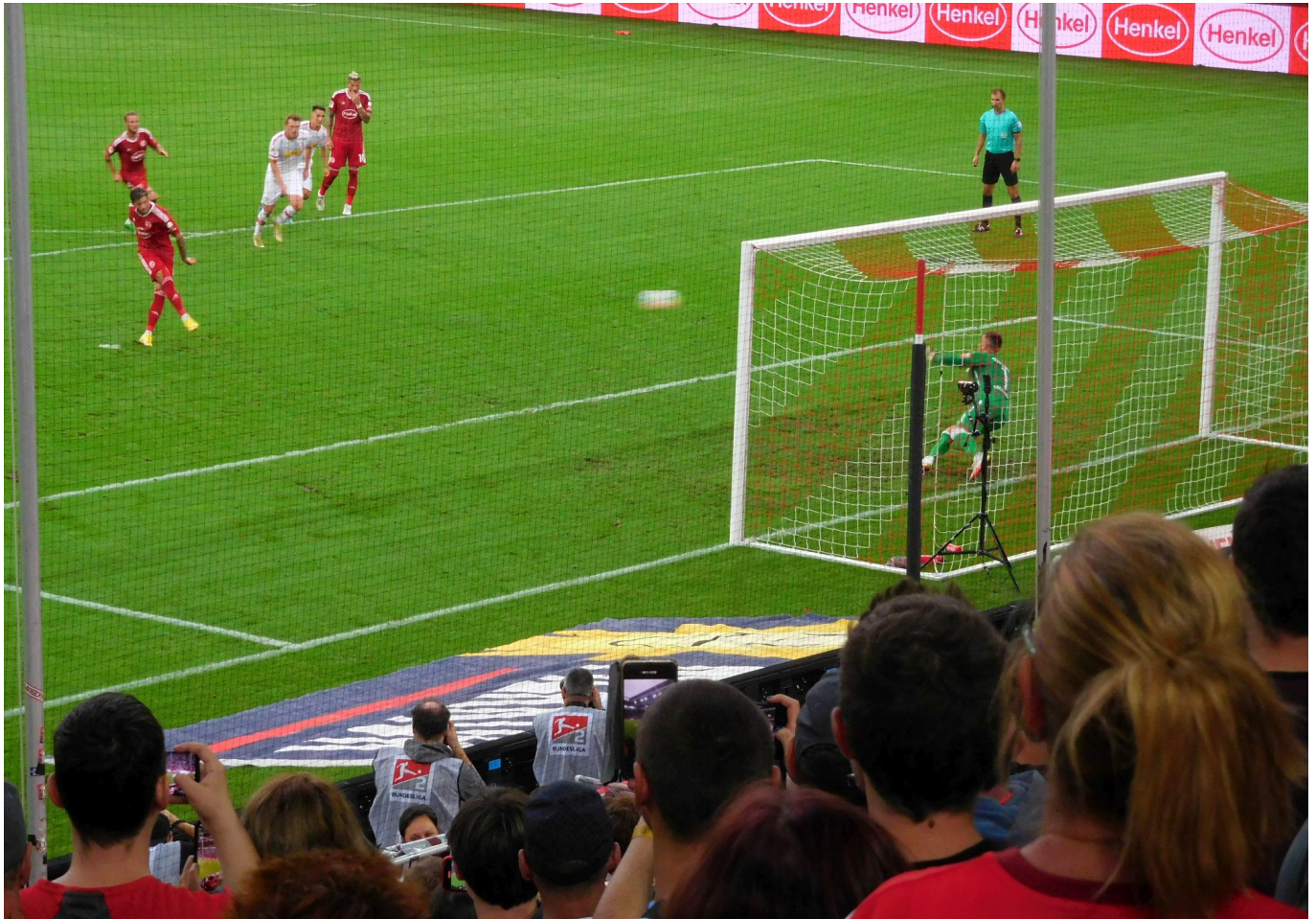
F95 vs Regensburg: Kownacki haut den Elfer rein