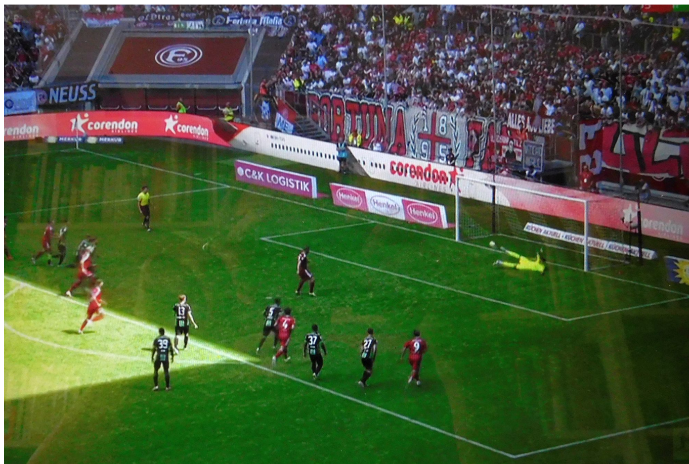
F95 vs Fürth: Der Keeper wehrt Hennings' Elfer ab