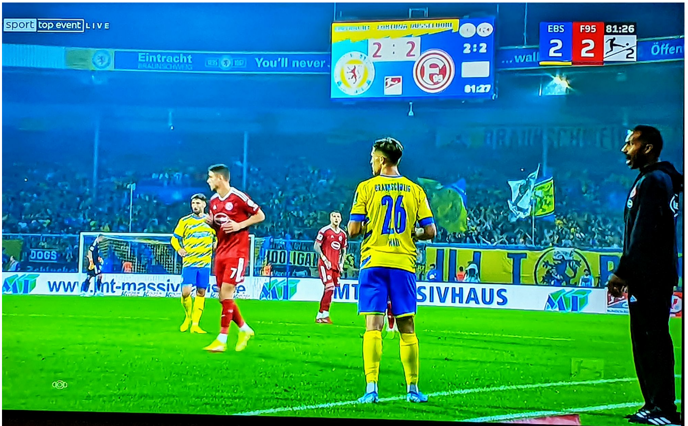
Braunschweig vs F95: Stimmungsvoller Abend, wildes Spiel

feine Bude. Das Remis war am Ende ein gerechtes Ergebnis. (7 Punkte / Platz 8)