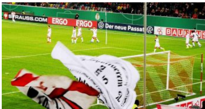
Nach dem Torjubel