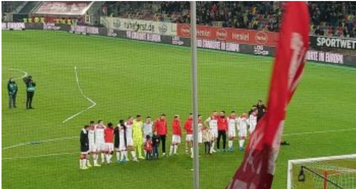
F95 vs Union: Man dankt sich gegenseitig

Fröhliche Weihnachten allerseits! Mit einem Punkt Vorsprung auf die Fischköpfe ist F95 inzwischen auf dem Relegationsplatz gelandet, was bedeutet: Hätten die Buben gegen Union nicht gewonnen, hätte der Christbaum schon erheblich gebrannt. Friedhelm wird wieder was geahnt haben, denn schon ein Remis gegen die Eisernen aus Köpenick hätte ihn den Stuhl gekostet, das war allen Beteiligten klar. Und was macht ein Funkel in einer solchen Situation? Er setzt volle Kanne auf Altbewährtes – mit Betonung auf „alt“. Hätte Michael Rensing für den etwas glücksarmen Zack rangemusst, hätte man eine Achse der Erfahrung auf dem Platz gehabt: Ayhan – Bodzek – Fink – Hennings. Immerhin sahen die Fortunen dieses Mal ausgesprochen entschlossen aus, sich die Weihnachtsferien nicht noch mehr zu vermiesen. Und, ganz böse interpretiert, haben die das Spiel ganz ohne Funkel'schen Beistand gewonnen – und zwar durch einen Hammer vom Rouwen und ein zauberhaftes Tricktor von Erik Thommy. Zufrieden konnte trotzdem niemand sein.