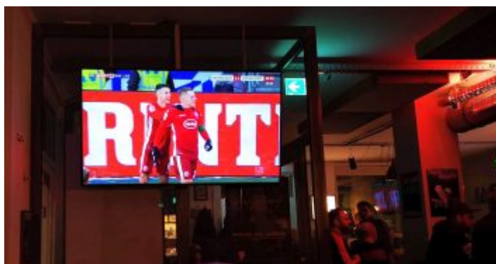
Hoffenheim vs F95: Na, wer hat das Tor gemacht? Genau...

Möglicherweise stellt dieses Unentschieden im Kraichgau den Beginn dieser blöden Remis-Serie dar, die F95 am Ende den Klassenerhalt gekostet hat. Möglicherweise war diese Partie aber auch der Anfang des unaufhaltbaren Abstiegs des lieben Friedhelm Funkel als Fortuna-