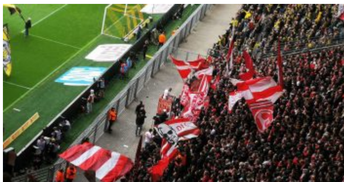
Ein praller Stehblock