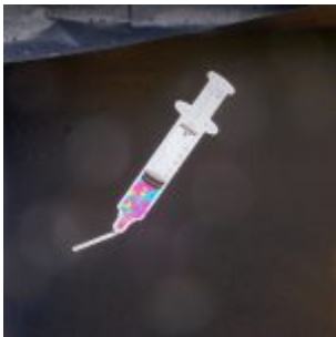
Aufkleber am Streckenrand