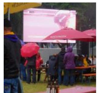
Champagner am GAP