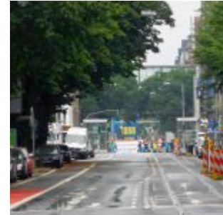
Feuerwehrdurchfahrt am GAP

Das war es also, das Zeitfahren durch die Stadt als erste Etappe der Tour de France 2017. Das Wetter hat nicht mitgespielt, aber das hat die Neugierigen und vor allem die vielen echten Tour-Fans nicht davon abgehalten, an der Strecke zu stehen und die Fahrer anzufeuern. Überhaupt: Den meisten Spaß hatten – das ergaben viele Gespräche – die Freunde des Radsports aus Frankreich, Belgien, den Niederlanden, Großbritannien und auch Tschechien. Deutsche Anhänger des Velo-Rennens gaben sich eher reserviert und jubelten vor allem den deutschen Fahrern und Teams zu.