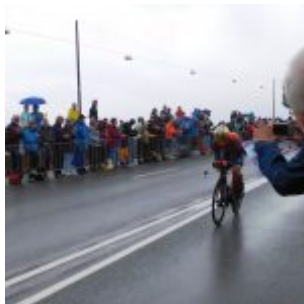
Schnell ein Foto