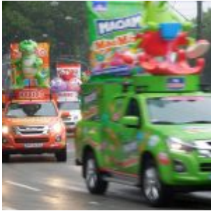
Die bescheuerte Werbekarawane