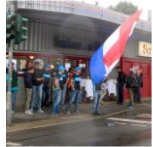
Allez La France