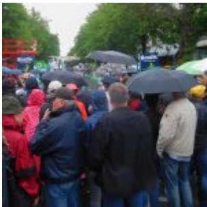
Zuschauer an der Kö