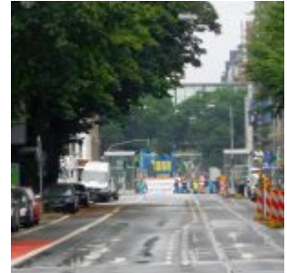
Feuerwehrdurchfahrt am GAP

Das war es also, das Zeitfahren durch die Stadt als erste Etappe der Tour de France 2017. Das Wetter hat nicht mitgespielt, aber das hat die Neugierigen und vor allem die vielen echten Tour-Fans nicht davon abgehalten, an der Strecke zu stehen und die Fahrer anzufeuern. Überhaupt: Den meisten Spaß hatten – das ergaben viele Gespräche – die Freunde des Radsports aus Frankreich, Belgien, den Niederlanden, Großbritannien und auch Tschechien. Deutsche Anhänger des Velo-Rennens gaben sich eher reserviert und jubelten vor allem den deutschen Fahrern und Teams zu.