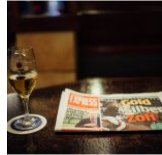
Bier trinken, Zeitung lesen