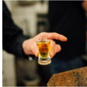
Ein Jülichka geht immer