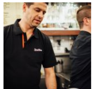
Die Brüder bei der Arbeit