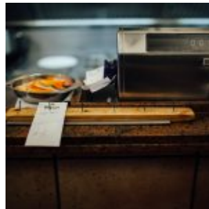
Bon und Kasse