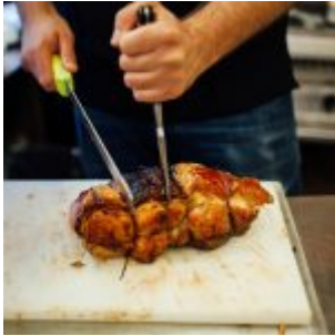
Knuspriger Schweinebraten – hier vom Ham-ham bei Josef