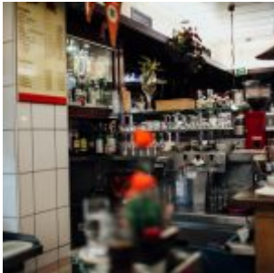
An der Zapfstelle