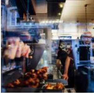
Einblick von außen