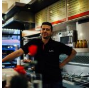
Mile am Grill