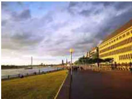
Blick vorbei am Behrensbau