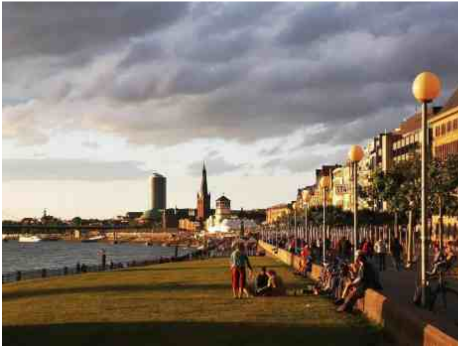
Lambätes und der Schlossturm