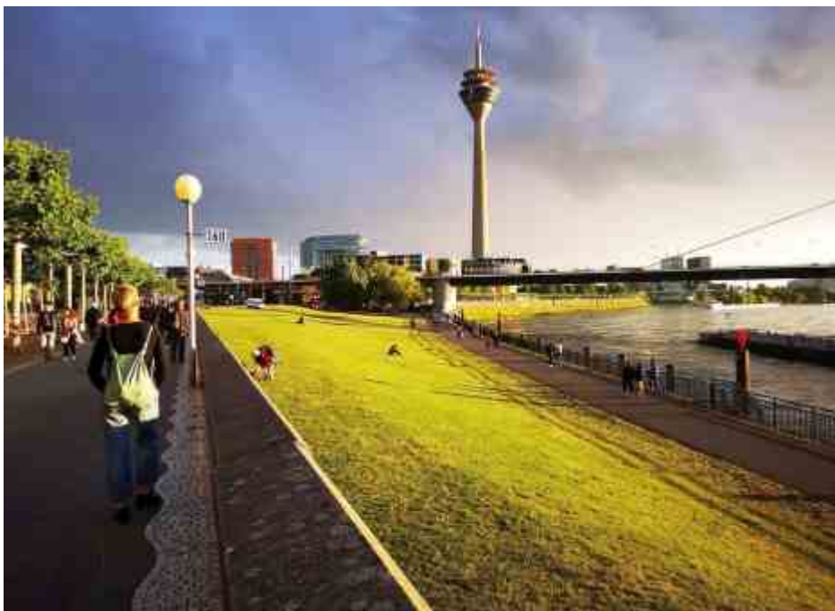
Grüner wird die Apollowiese nicht