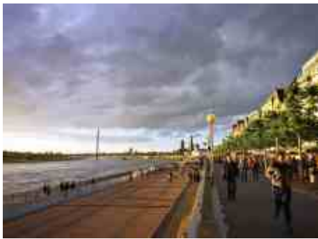
Das untere Rheinwerft