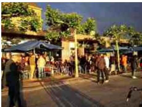
Jazz-Rally-Publikum am KIT