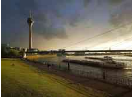
Drama zwischen Rheinturm und Kniebrücke