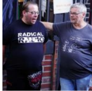
Über Musik reden