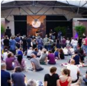
Die Bühne im Hof