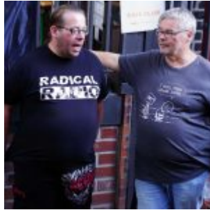
Über Musik reden