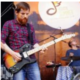
Mann am Bass