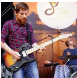
Mann am Bass