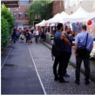
Die soziale Gasse