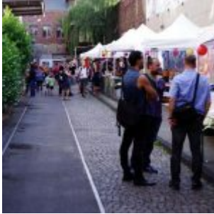
Die soziale Gasse