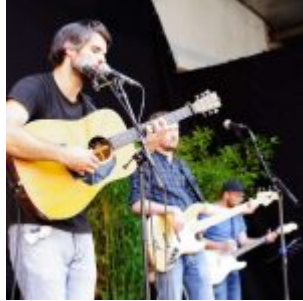
Die Band Hello Pied Piper