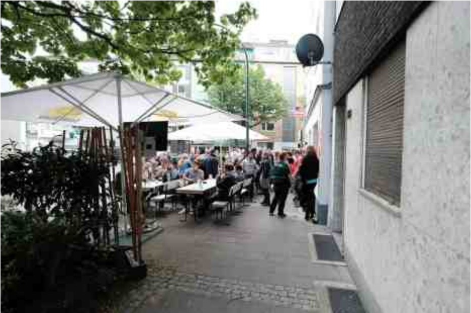
Bilker Häzz - die Terrasse an der Talstraße