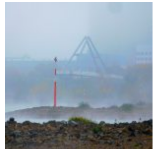
Fußgängerbrücke in den Hafen