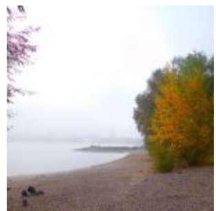
Die Bucht im Nebel