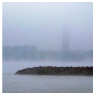
Nebelschwaden über dem Rheinknie