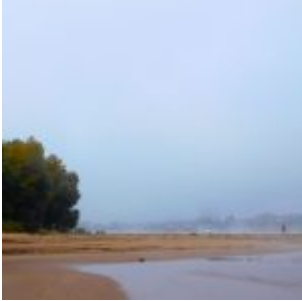
Liebende im Nebel

Das Schönste am Herbst ist der Nebel. Der schönste Nebel ist der überm Rhein. So entstanden die Fotos beim Hundegang am Paradiesstrand.