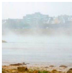
Drüben ist Oberkassel