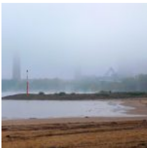
Der Stumpf des Rheinturms