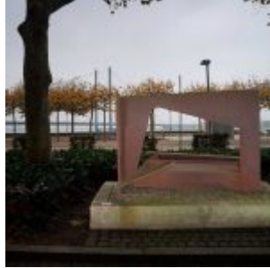
Mannesmann-Plastik an der Rheinuferpromenade