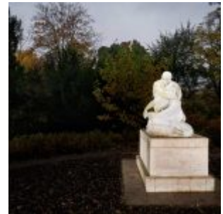
Adam und Eva im Florapark