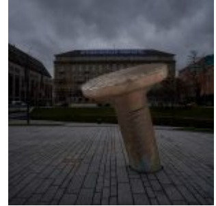
Bergischer Löwe am Südennde der Ballwerferin am Graf-Adolf-Platz Ueckers Nagel am Kö-Bogen Kö

Neu in der Runde der Fotografinnen und Fotografen, die ihre Bilder auch auf The Düsseldorfer präsentieren, ist Grzegorz Bieniek . Er stammt aus Breslau (Polen) und hat 2002 als freier Fotoassistent in Düsseldorf begonnen. Seit 2011 ist er als freier Fotograf unterwegs und arbeitet für namhafte Kunden aus ganz Deutschland. Vor einigen Monaten haben wir uns darüber unterhalten, dass es in Düsseldorf außergewöhnlich viele Skulpturen im öffentlichen Raum . Daraus entstand Grzegorz's Idee für diese Fotostrecke. Er hat eine Auswahl seiner Lieblingsskulpturen aufgenommen und auf seine spezielle Art bearbeitet. Das Ergebnis ermöglicht einen neuen Blick auf Dinge in der Stadt, an denen wir oft achtlos vorübergehen. [Ein Klick aufs Bild bringt es in Originalgröße und -format.]