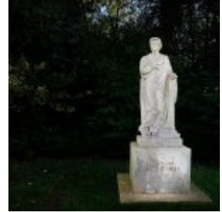
Feuerbach-Denkmal im Volksgarten