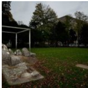
Heinrich-Heine-Monument auf dem Schwanenmarkt