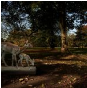
Die Rehe im Volksgarte