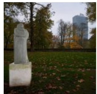
Mutter Ey am Stadtmuseum