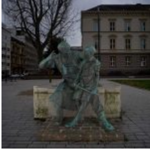
Schmied und Knabe auf dem Martin-Luther-Platz