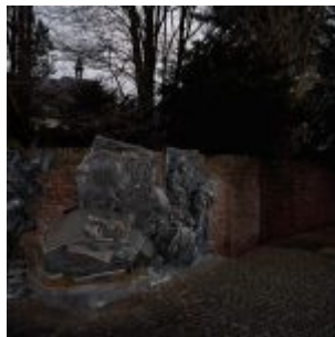
Stadterhebungsmonument am Burgplatz