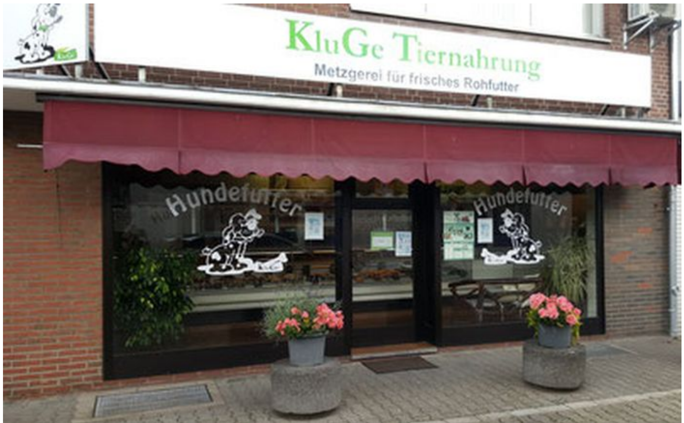
Die BARF-Metzgerei Meiritz in Neuss-Selikum

Weil Meiritz so beliebt ist, herrscht oft großer Andrang, sodass man – besonders in den Zeiten der Corona-Pandemie – gelegentlich lange Wartezeiten einkalkulieren muss. Zumal viele Züchter aus der Region hier die benötigten Mengen einkaufen. Wie rohes Fleisch, das für den Menschen gedacht ist, hält sich auch das BARF-Fleisch von Meiritz im Kühlschrank nur eine begrenzte Zeit. Wer gleich größere Mengen einkauft, muss das Fleisch also portionieren und selbst einfrieren. Über die Herkunft der verarbeiteten Tier geben die freundlichen Leute im Laden gern Auskunft. Auch umfassende BARF-Beratung wird angeboten.