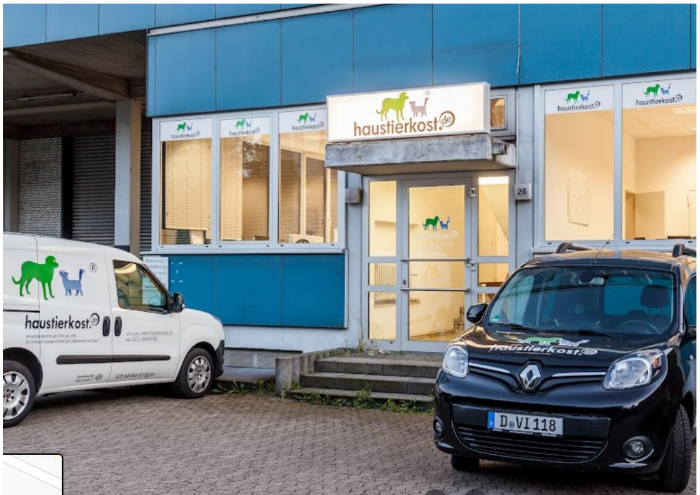
Das Versandzentrum von haustierkost.de in Heerdt

[Hinweis: Die vier genannten Anbieter haben wir ausgewählt, weil unsere Windhunde Pina, Clooney und Holly schon mit Produkten dieser Firmen gefüttert wurden oder noch gefüttert werden. Insofern ist die Auswahl subjektiv. Denn natürlich gibt es weitere gute Einkaufsquellen für Frischfleisch und BARF-Produkte in Düsseldorf.]