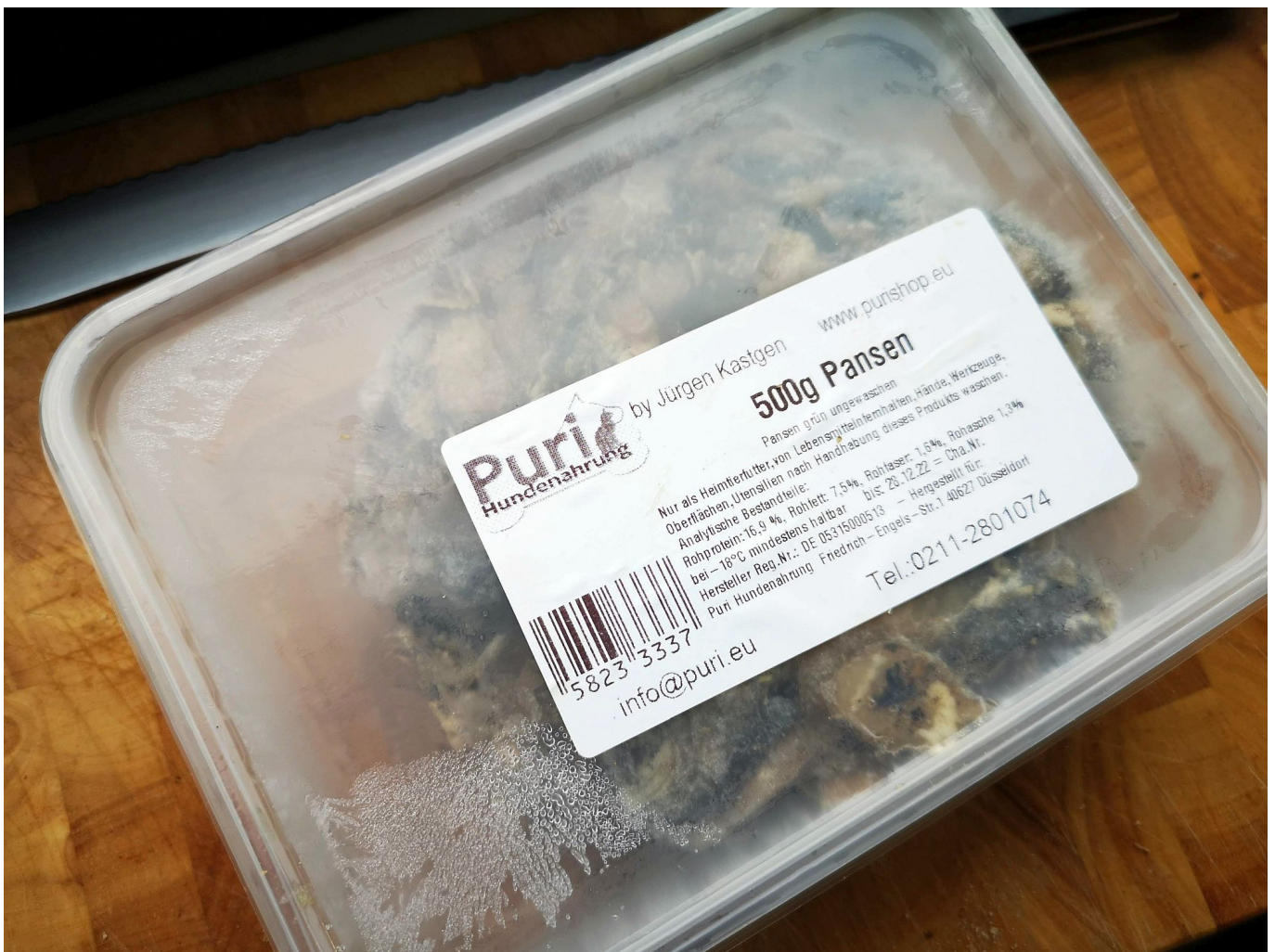
Lecker TK-Pansen von Puria

schaden. Und hier liegt auch das Problem mit dem 08/15-Hundefutter, das man immer noch in Dosen zu Cent-Beträgen oder als Trockenfutter bekommt. Gerade die billigen Sorten enthalten meistens Zucker und oft auch Salz so wie bestimmte Substanzen, die den verzehrenden Hund abhängig machen können. Dem Vierbeiner solches Zeug vorzusetzen ist das genaue Gegenteil von artgerechter Fütterung.