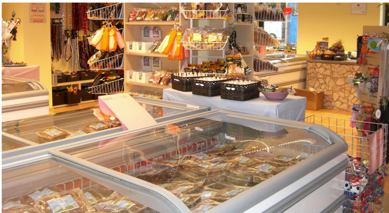
Blick in die Pfotenbar in Flingern

In den Tiefkühltruhen lagern mehrere Dutzend Sorten Fleisch, teils in TK-Beuteln oder -Würsten verschiedener Hersteller. Alles, was es sonst noch zum Barfen braucht, findet sich ebenfalls. Dazu ausgewähltes Fertigfutter. Gerade für BARF-Anfänger wichtig ist die hochkompetente, individuelle Beratung.