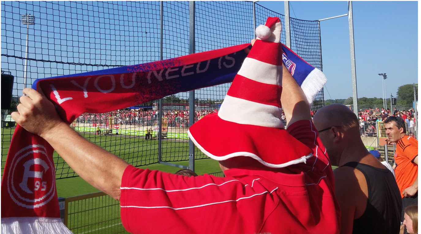
2015: F95 vs ITFC – Endlich Fußball: Fanschal auf der Südtribüne im PJS

Das passte gut zur massiven Veränderung der Business-Seite des Profifußballs nach der Bosman-Entscheidung aus dem Jahr 1995, das die Art und Weise wie Spielerwechsel ablaufen, bis auf den heutigen Tag prägte.