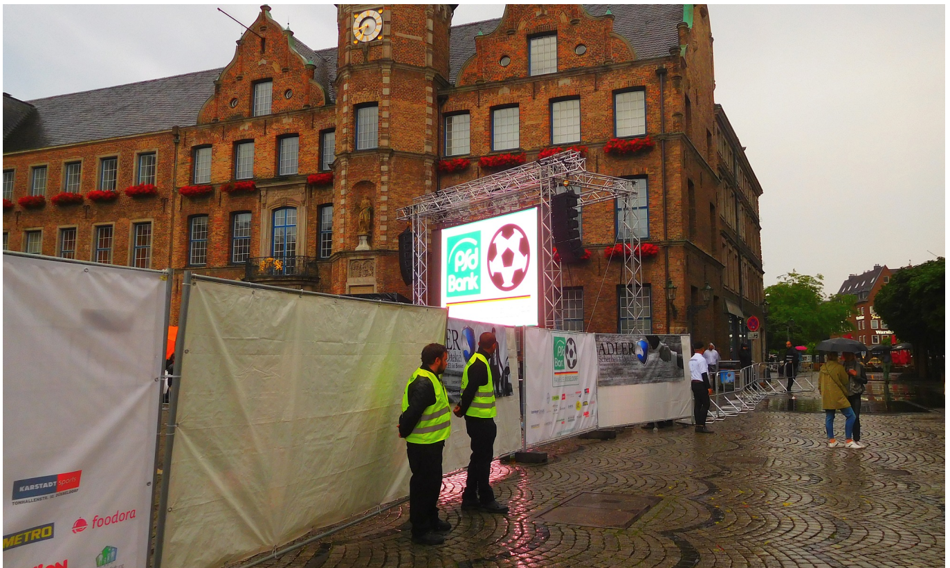
EM 2006: Public Viewing auf dem Marktplatz – eine Farce

Die Schere zwischen Fans und Konsumenten – von Ultras gern „Eventies“ genannt – ging immer weiter auf. Man muss Franz Beckenbauer bei all seiner Korruption attestieren, dass er in der Vorbereitung und Durchführung der Fußballweltmeisterschaft 2006 das richtige Näschen für die Tendenz im Berufsfußball hatte – oder von skrupellosen Typen umgeben war, die wussten, wie der Hase laufen würde und davon profitieren wollte. Ein ganz neuer Typ Fan entstand. Junge Männer und neuerdings auch Frauen in großer Zahl betrachteten „Fansein“ so wie sie das bei anderen Elementen der Popkultur trieben: Man bekannte sich schrill, bunt und laut zu seinen Stars, um eine möglichst lange und intensive Gelegenheit zu haben, das zu tun, was man seit rund 20 Jahren euphemistisch „feiern“ nennt.