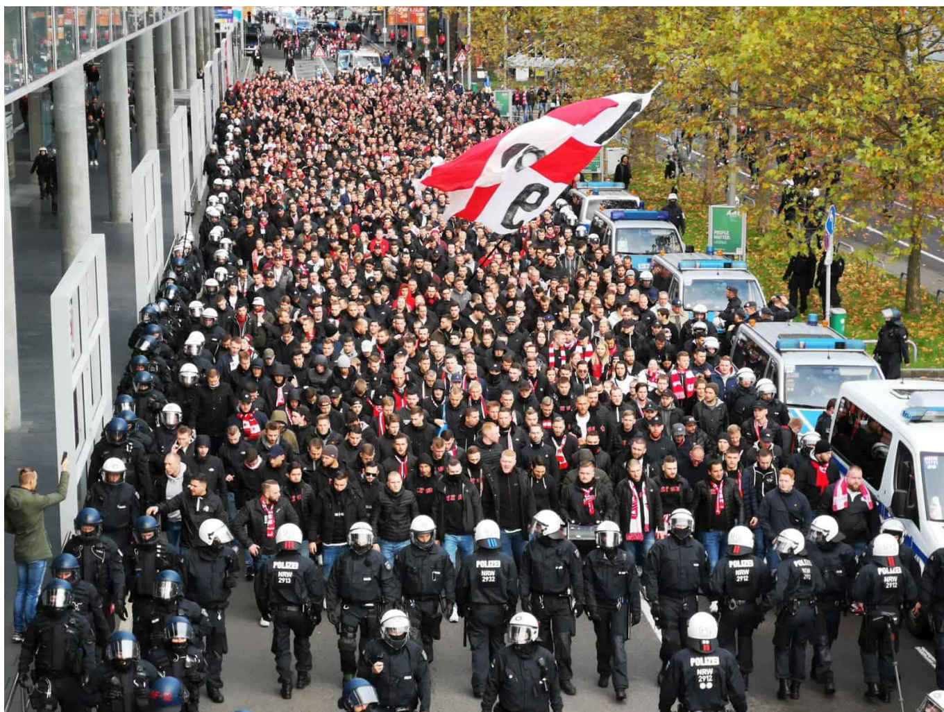
November 2019: Fanmarsch zur Arena

Vor allem aber brachten Arbeiterjungs, die nun regelmäßig in größeren Gruppen ins Stadion strömten, eine ganz andere Atmosphäre. Lautstarke Anfeuerungen ersetzen das Gemurmel der Renter und das Stöhnen der Angestellten bei vergebenen Torchancen. Die Burschen aus den Fabrikhallen von Mannesmann, Rheinmetall, Klöckner und den anderen Betrieben der Schwerindustrie, aber auch junge Handwerker brachten die Emotion ins Rheinstadion, das zur WM im eigenen Land von 1974 völlig neu gebaut worden war. Bald eroberten sich die jungen Leute den Block 36 und die angrenzenden Blöcke, weil es dafür die billigsten Karten gab.