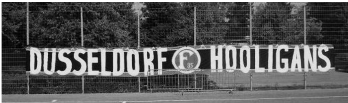
Düsseldorf Hooligans

Während aus dem beschriebenen Fanvolk auch in unserer Stadt die Hooligan-Szene nach englischem Vorbild entstand, kamen andere Teile der Jugendkultur erst ein bisschen später zur Fortuna. Vor allem die frühen Punker entdeckten den Fußball um die Wende von den Siebzigern zu den Achtzigern für sich. Und während sich Teile der Hool-Gruppen (ähnlich wie in England) den rechten Bewegungen annäherten, standen die Freunde der Punk-Musik eher links. Zumal die fast durchgehend ausschließlich aus eher braven, bürgerlichen Familien standen, in denen man schlimmstenfalls konservativ, meist aber liberal dachte.