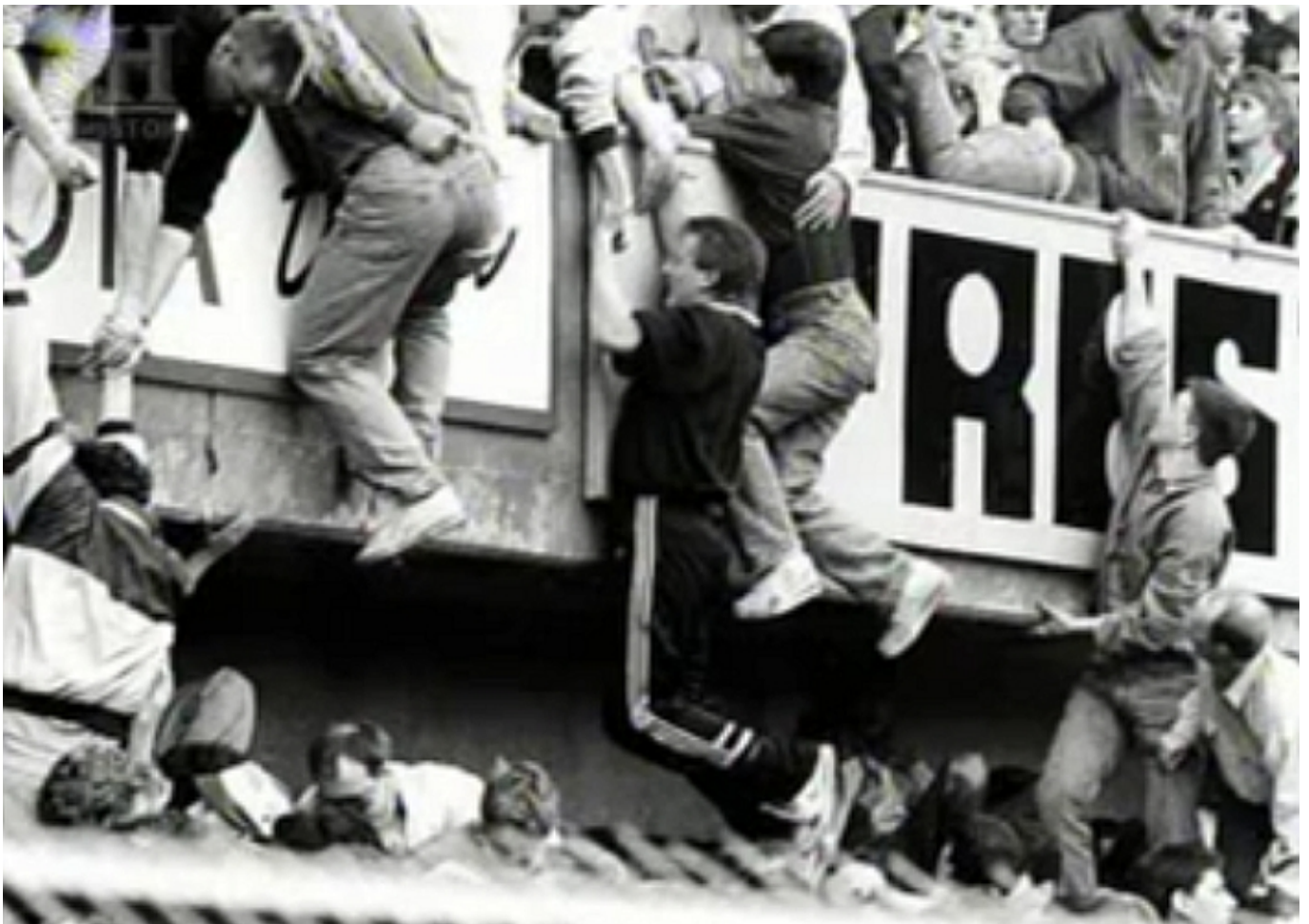
15.04.1989: Das Hillsborough-Desaster

Blöcken standen, zu mehr oder weniger straffen Gruppen und Clubs zusammen. Der Ton wurde rauer, und es entstanden Rivalitäten zu den Fans anderer Clubs. Und so wie sich junge Arbeiter aus verschiedenen Stadtteilen schon immer auf der Kirmes zu Prügeleien getroffen hatten und es in der Altstadt regelmäßig zu Schlägereien kam, so zog die körperliche Gewalt auch in die frischgebackene Fankultur ein.