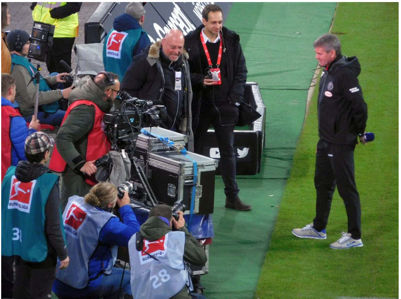
2018: Medienrummel um Funkel

Aufstiegsfeiern auf dem Marktplatz und in der ganzen Altstadt wird niemand vergessen, die:der dabei war. Dann kam der sportliche Misserfolg, dann kam die Entlassung von Friedhelm Funkel, dem F95-Trainer auf den sich bis dahin die gesamte Fanszene hatte einigen können, dann kam der Abstieg und dann kam Corona und damit die Geisterspiele.