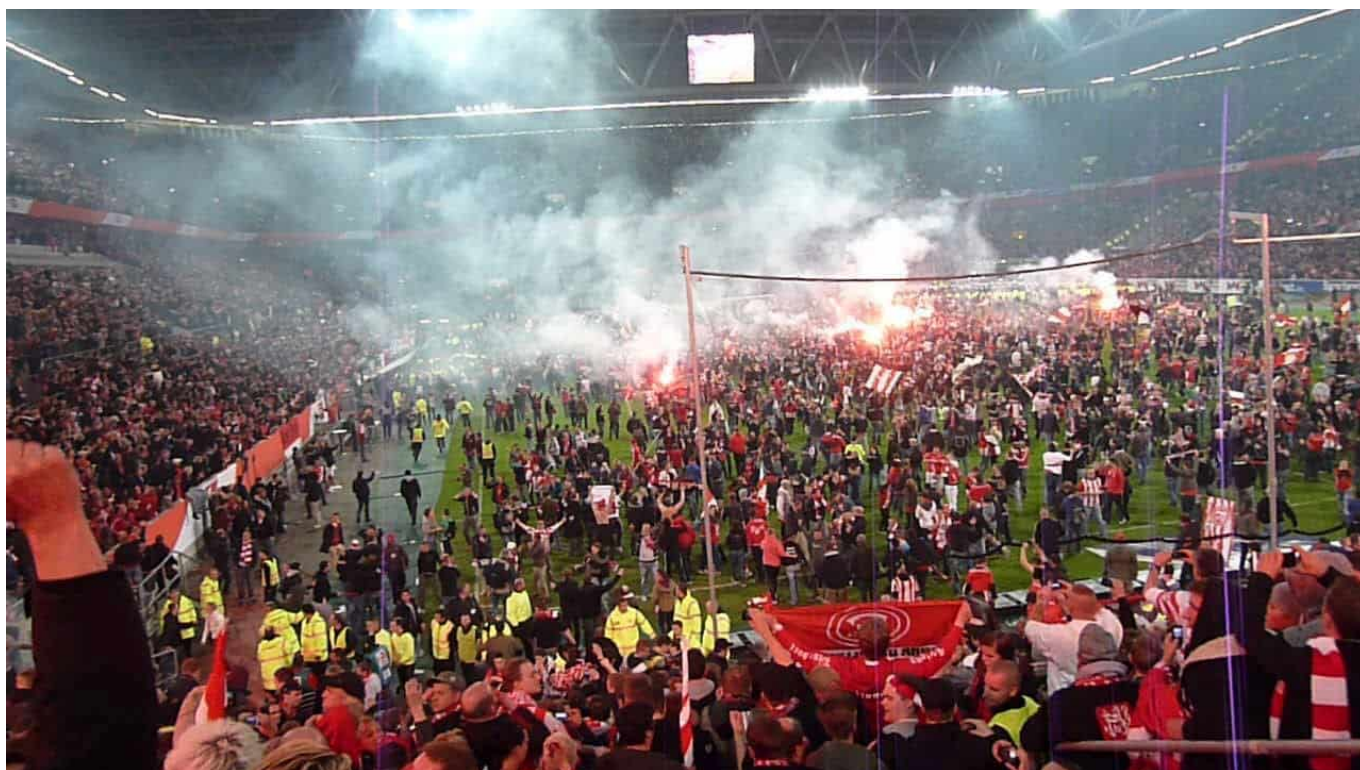
Platzsturm: Nach der Relegation im Mai 2012 gegen die Hertha - Aufstieg!

Dazu kam bei der Fortuna (wie bei anderen Vereinen auch), dass Rechtsradikale und Rechtsextreme eigene Gruppierungen gegründet oder sich in bestehende Fanclubs eingeschlichen hatten und aus ihrer Sicht „linke“ Ultras gewalttätig angriffen. Weil es der hiesigen Ultra-Szene um 2010 herum nicht gelang, die angegriffenen zu integrieren und sich mit ihnen solidarisch zu verhalten, spaltete sich die Fanszene. Jede Menge Stadionverbote und teilweise auch strafrechtliche Verfolgung schwächte die Szene in der Folge immer mehr. Und trotzdem: Dem Verbund von Ultra-Gruppen, der als UD bekannt ist, gelang es gegen jeden Widerstand den inneren Zusammenhalt wiederherzustellen und die Abwanderung von Leuten, die sich langsam für zu alt hielten, zu kompensieren. Ja, viele Anhänger anderer Clubs blickten über mehrere Jahre neidisch auf die Fanszene der Fortuna, die in der eigenen Arena lautstark und konzertiert für Support und Stimmung sorgte und bei manchem Auswärtsspiel die akustische Oberhand behielt.