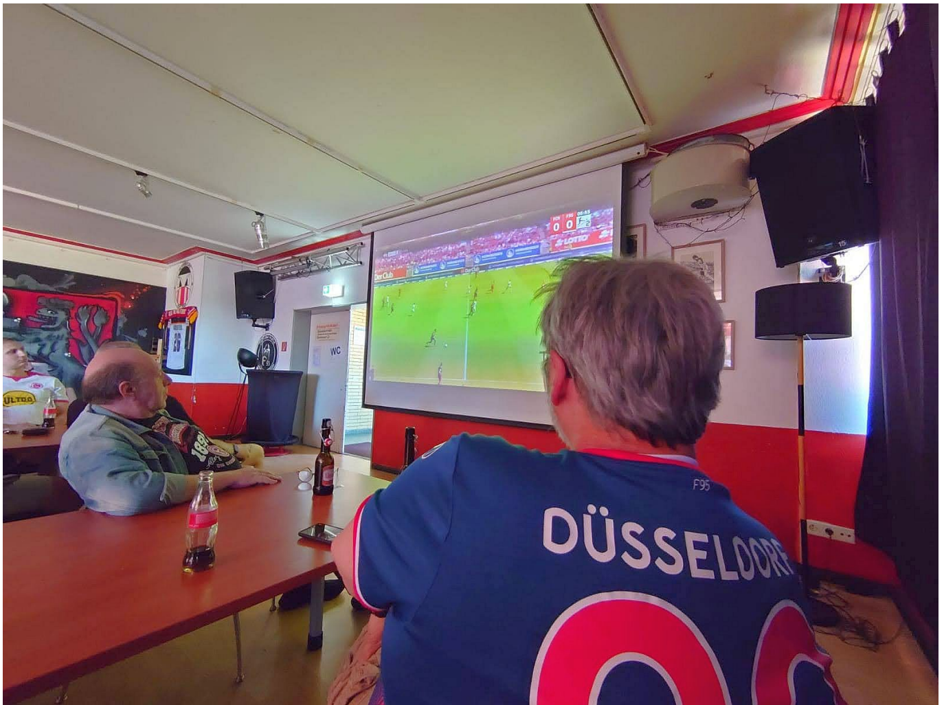
Nürnberg vs F95: Experterunde zu Gast bei den Ultras in der Bar95

der Süd zusammen gestanden hatten, zerfielen. Seit mindestens einem Jahr ist klar: Es wird nie wieder so sein wie früher.