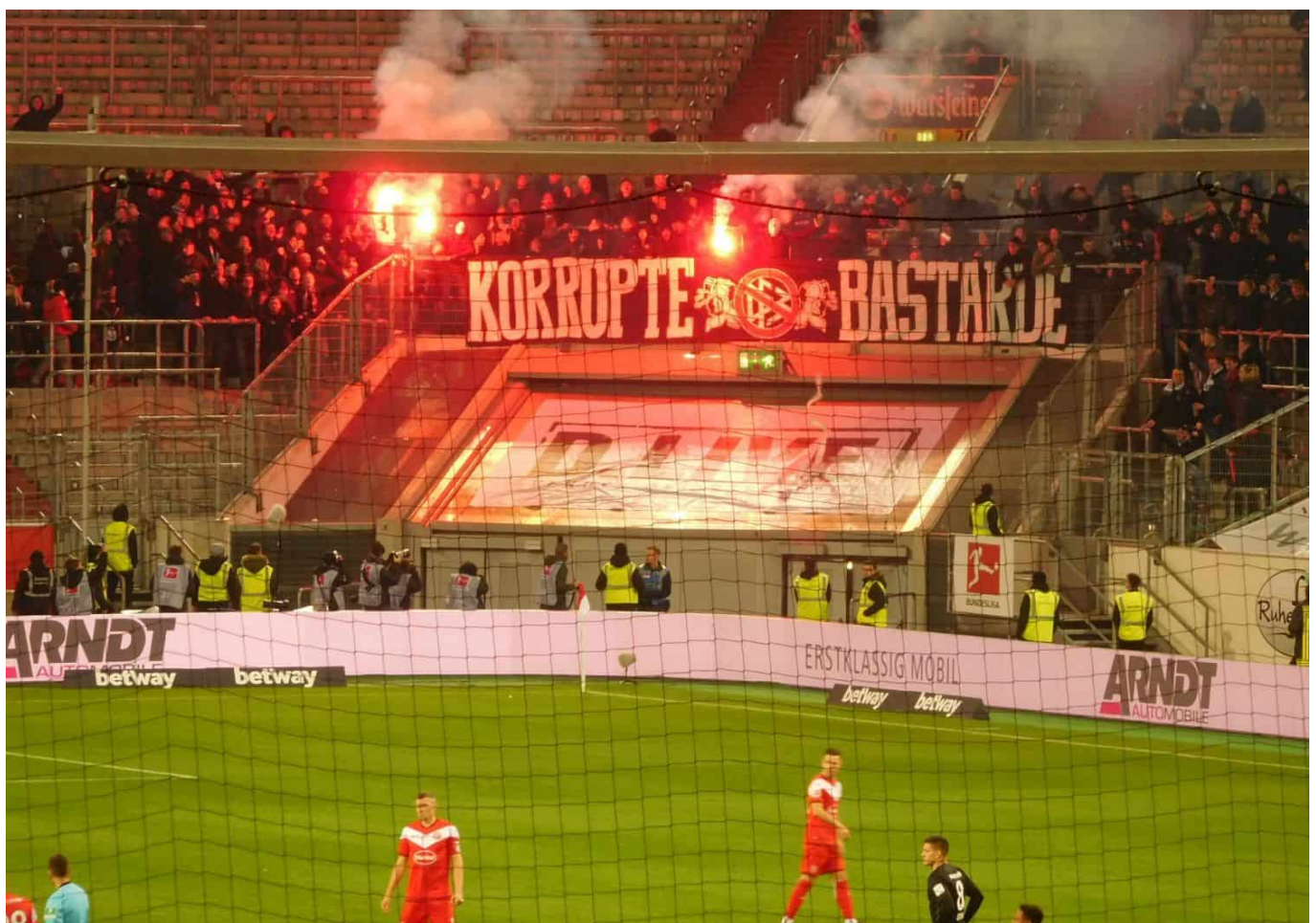
März 2019: F95 vs SGE: Bisschen Pyro

wankelmütigen Eventies in einen Topf geworfen werden, die sich entweder Bayern-Fans nannten oder je nach Erfolg meinten, „Fans“ eines anderen Vereins zu sein und dies durch Anhäufen von Merchandising-Produkten nach außen kehrten. Und damit begann auch der Kampf der Fanszenen gegen die Kommerzialisierung, also gegen die DFL und den DFB, aber natürlich auch die Kräfte, in deren Interesse die Kommerzialisierung vorangetrieben wurde: die Privatfernsehsender. Legendär der Gesang „Eure Mütter ziehen LKW auf DSF...“ und Transparente wie „F*** dich DFB“.