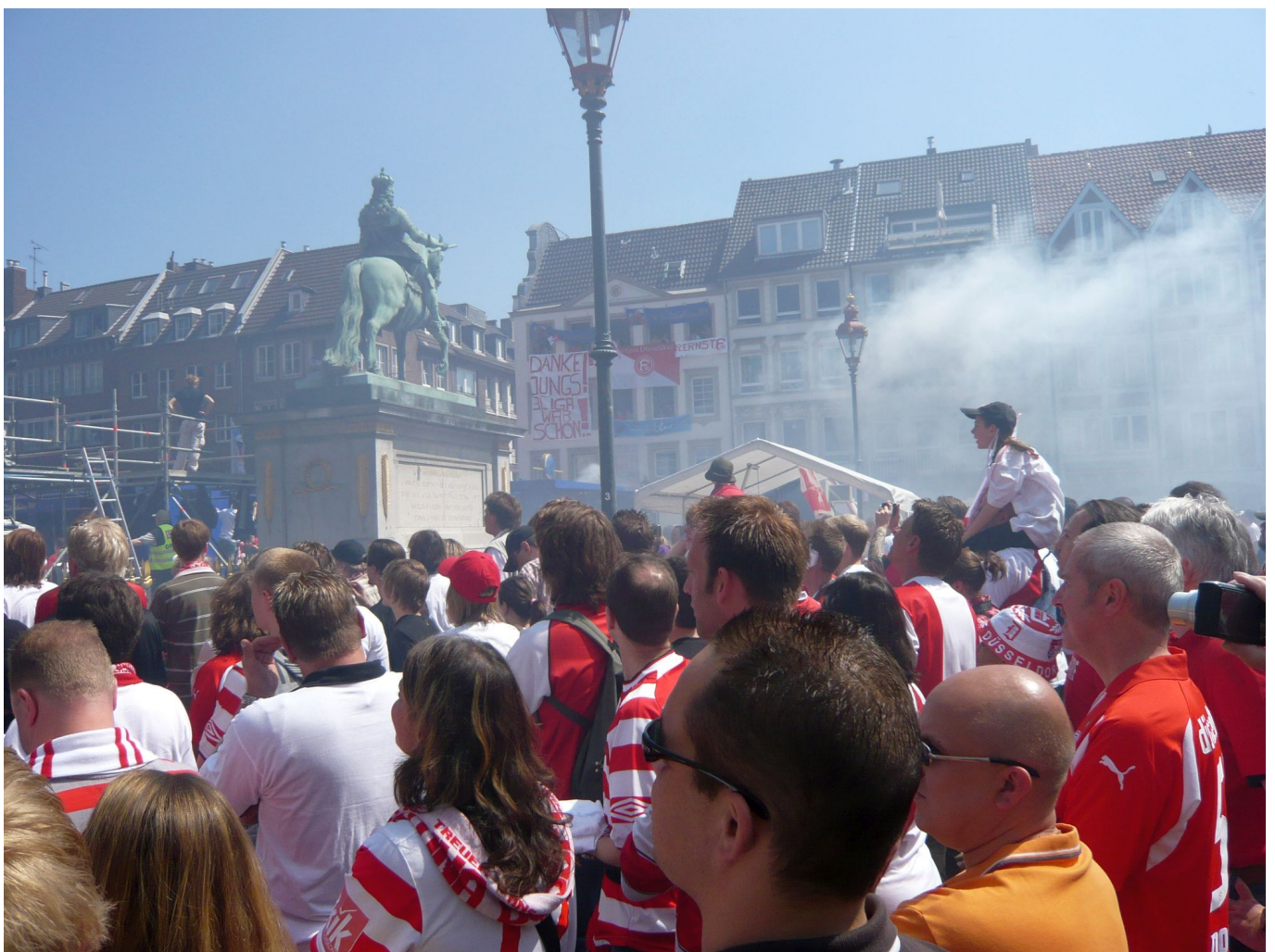
Aufstieg 2009: Bisschen Pyrodampf auf dem Marktplatz (Aufstieg 2009)

Wie wesentlich der Support durch Ultras und aktive, engagierte Fans für das Produkt „Fußball“ war, demonstrierten die Anhänger in der Saison 2012/13 mit der Aktion 12:12. Man schwieg bei jedem Spiel in den ersten zwölf Minuten. Keine Trommel schlug, kein Kapo animierte seine Leute, keiner der gängigen Anfeuerungssongs wurde gesungen, nicht einmal die Wechselrufe bei der Durchsage der Aufstellungen fanden statt. Es war gespenstisch, beinahe noch gespenstischer als die Atmosphäre in den Arenen bei den corona-bedingten Geisterspielen.