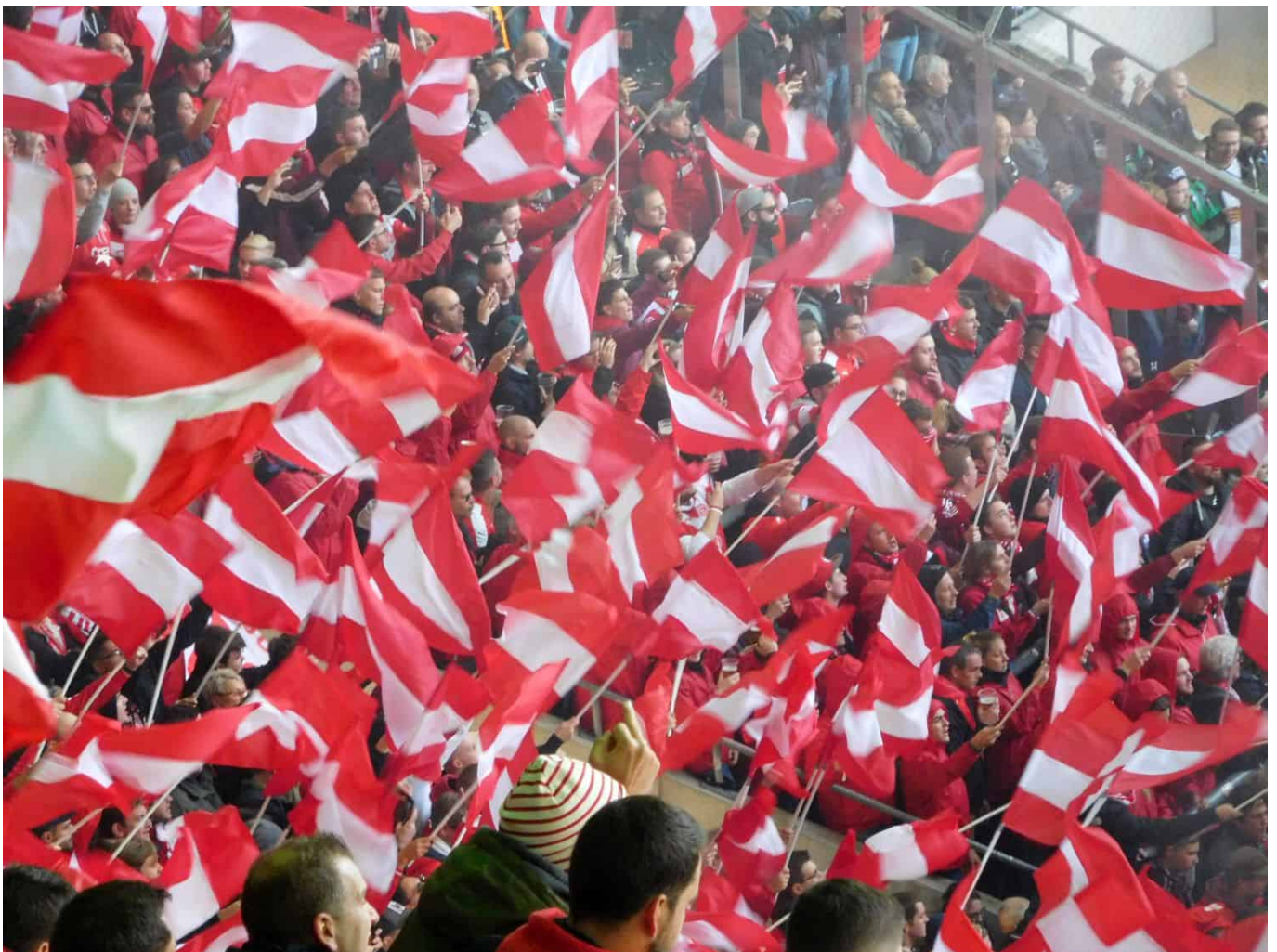
November 2018: Fähnchen

Eine entscheidende Rolle beim großen Austausch der Fußballfans gegen die Fußballkonsumenten spielte die Ankunft des Privatfernsehens im Jahr 1985 als Ergebnis der Kohl-Kirch-Machenschaften und insbesondere die Vergabe von Senderechten der Bundesliga an RTL und die Sendung „Anpfiff“. Von diesem Zeitpunkt an spielten die Interessen der Werbetreibenden eine starke Rolle bei der Haltung des DFB gegenüber der Fankultur. Gewünscht war nun zunehmend ein Fußball mit glatter, sauberer Oberfläche, eine TV-Sport für die ganze Familie – entweder vor der Glotze oder im „Familienblock“ im Stadion. Das Raue, Ungestüme, Wüste und auch Böse wurde dem Fußball – nicht nur in Deutschland – systematisch ausgetrieben.