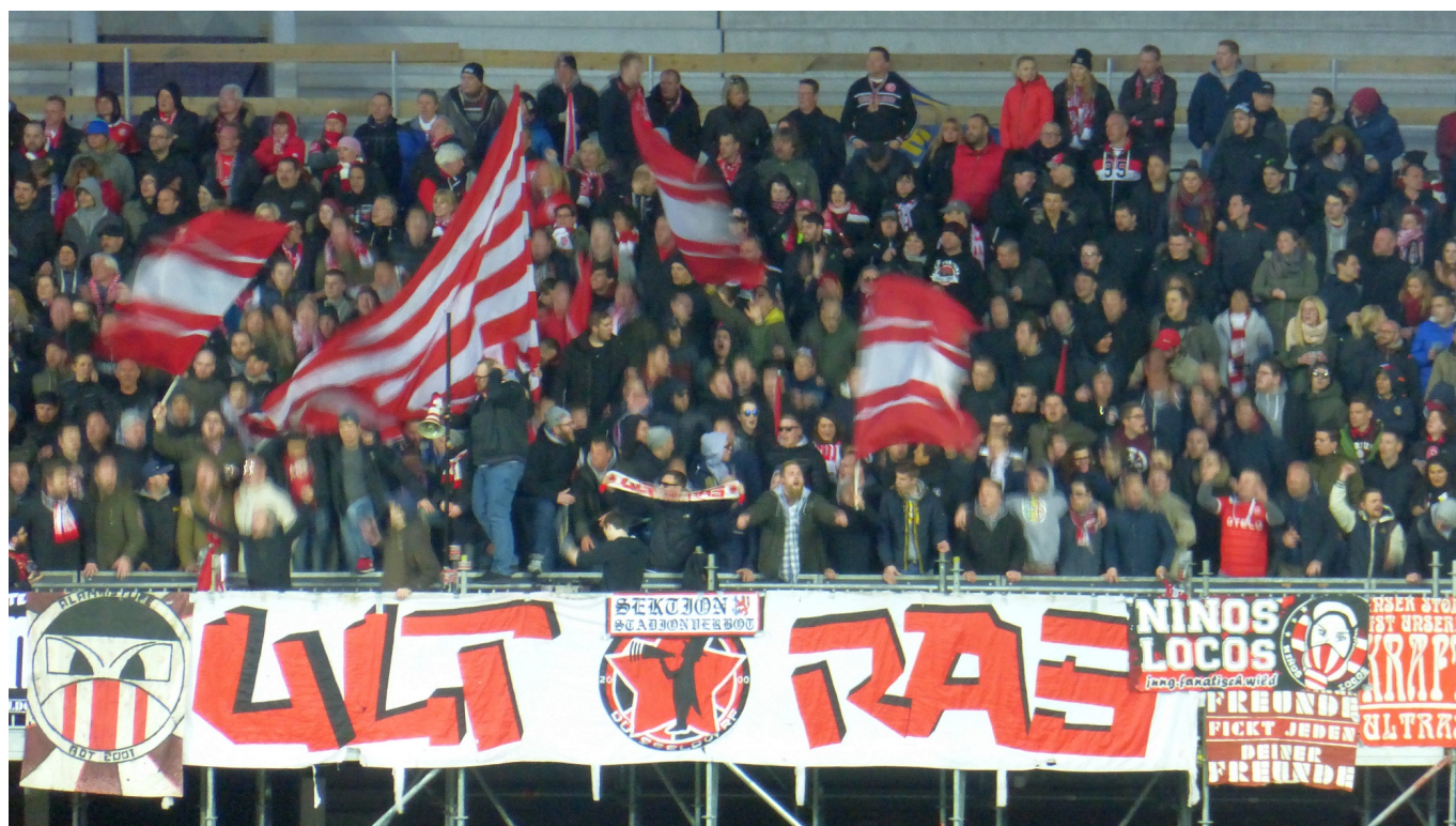
Fortuna-Ultras in Aktion (in St. Pauli 2015; Foto: TD)

mit der Popkultur, und die Klassenunterschiede hatten sich – so wie in der Gesamtgesellschaft – verwischt. Das führte im Verbund mit anderen Faktoren zu einem drastischen Umbruch der Fanszenen in Düsseldorf und auch in den anderen Städten mit starker Bindung an einen Fußballverein. Weil es so viele andere Möglichkeiten der Identifikation und Gruppenbildung gab, kam es bundesweit zu einem deutlichen Rückgang der Zuschauerzahlen. Der DFB führte diesen Rückgang auch darauf zurück, dass zahlungskräftige und konsumfreudige Zuschauer von der Gewalt in und um die Stadien herum abgeschreckt worden waren und erklärten allen, die sie für Hools hielten, den Krieg.