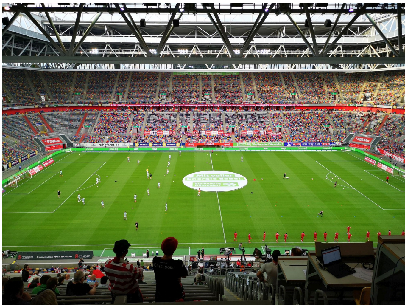
F95 vs Bremen: Blick auf die Gegentribüne ca. eine Stunde vor Spielbeginn

Die fette Kohle sollte noch fetter werden, das war ab 2006 erklärtes Ziel der DFL, die ihre Ligen nicht mehr als Sportveranstaltungen, sondern als Entertainment-Events zur Maximierung von Gewinnen betrieb. Dazu musste der Fußball noch stromlinienförmiger, noch familiengerechter werden. Inzwischen hatte der DFB gemerkt, dass die Fußballfankultur sich zu einer im wahrsten Wortsinne Subkultur entwickelt hatte, die sich vom offiziellen Sport teilweise abgekuppelt hatte. Für viele engagierte und aktive Fans – nicht nur aus dem Ultra-Umfeld – war nicht mehr nur das Spiel wichtig und die eigene Mannschaft, sondern das Sozialleben mit anderen Fans. Der Block war ihr Dorf, Auswärtsfahrten Familienausflüge und Butterfahrten zugleich.