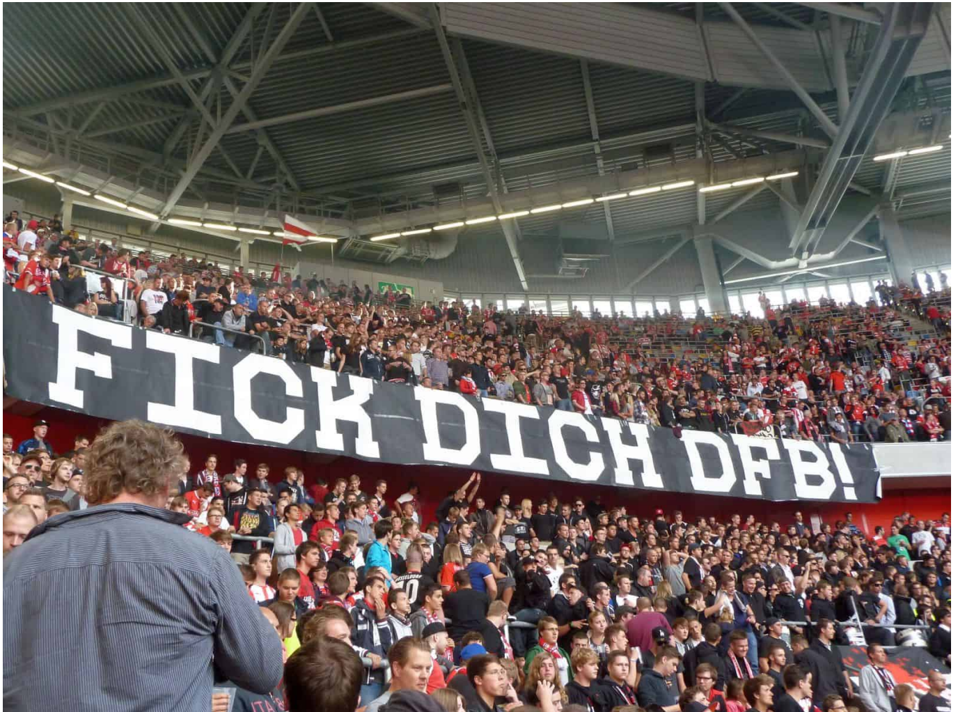
Klare Meinungsäußerung aus gutem Grund

Den Verantwortlichen beim DFB und dann auch der DFL fielen die Ultras zunächst nicht besonders, vor allem nicht: besonders geschäftsschädigend auf. Dass deutsche Ultras nach italienischem und griechischem Vorbild auf Stümmung durch das Abbrennen von Rauchkerzen und bengalischen Fackeln setzten, wurde erst einmal toleriert. Dafür boten die Extremfans mit ihren Trommeln, Schlachtrufen und Gesängen ja auch die emotionale Kulisse, die sich das Fernsehen und die Werbeindustrie wünschten.