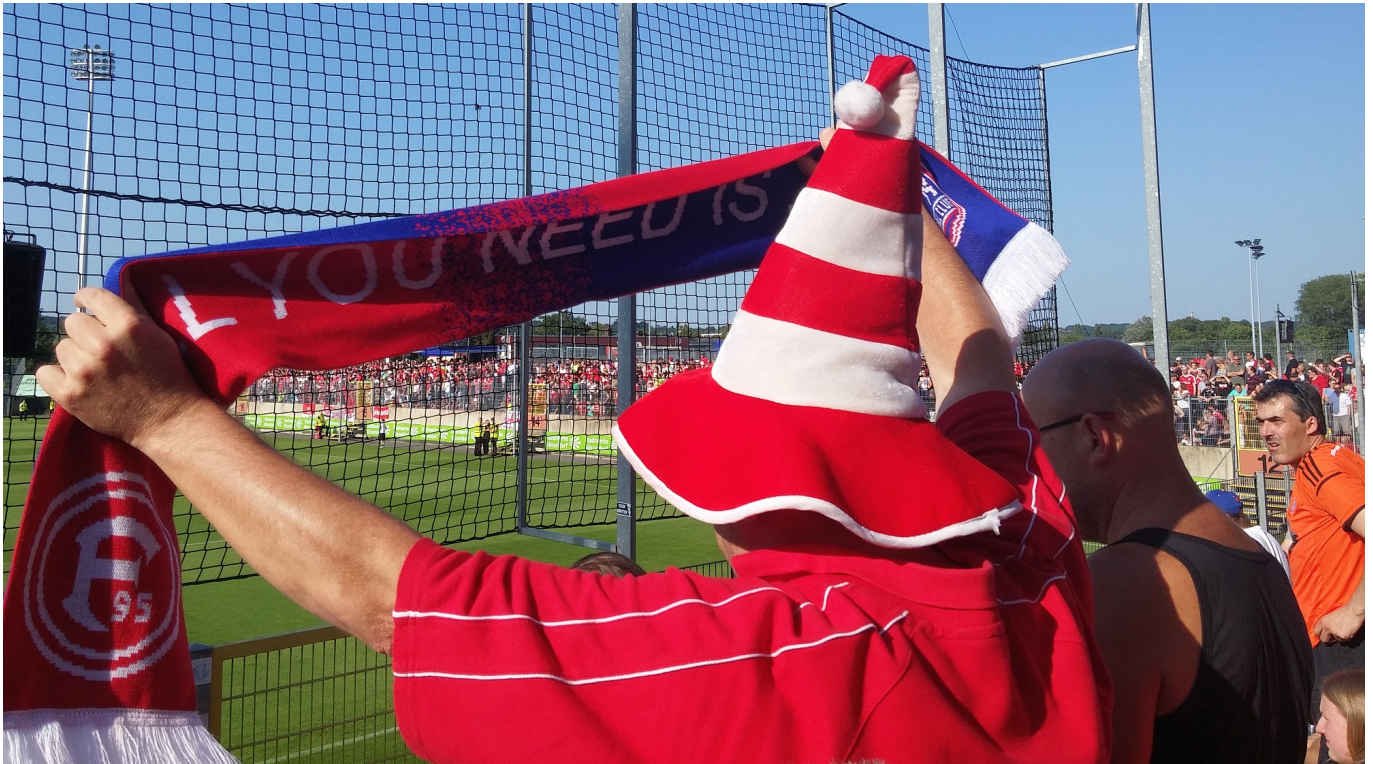
2015: F95 vs ITFC – Endlich Fußball: Fanschal auf der Südtribüne im PJS

Das passte gut zur massiven Veränderung der Business-Seite des Profifußballs nach der Bosman-Entscheidung aus dem Jahr 1995, das die Art und Weise wie Spielerwechsel ablaufen, bis auf den heutigen Tag prägte.