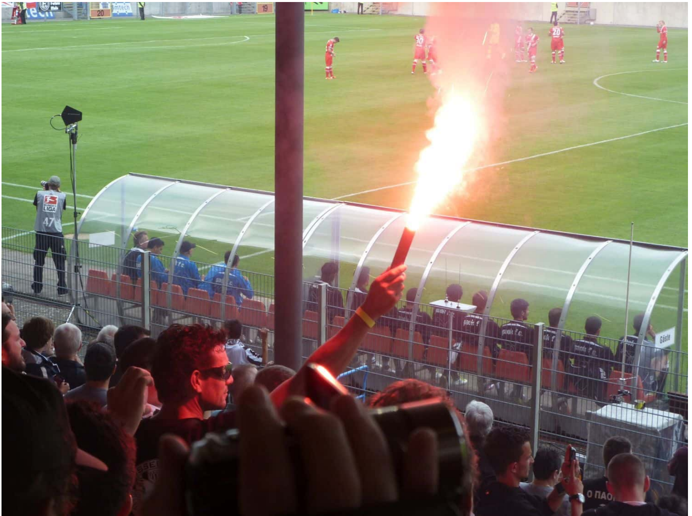
Juli 2011: F95 vs PAOK

vom Verein. Die ersten Fanshops – eröffnet vom HSV und dem Äff-Zeh – gab es erst ab ungefähr 1982. Und dann konnte man dort lediglich offizielle Mützen, Schals und Fahnen erwerben. Wer bis etwa 1980 mit einem Trikot in den Farben des Vereins ins Stadion ging, der besaß eines der Jerseys, die Fußballer manchmal nach dem Abpfiff an Fans verschenkten.