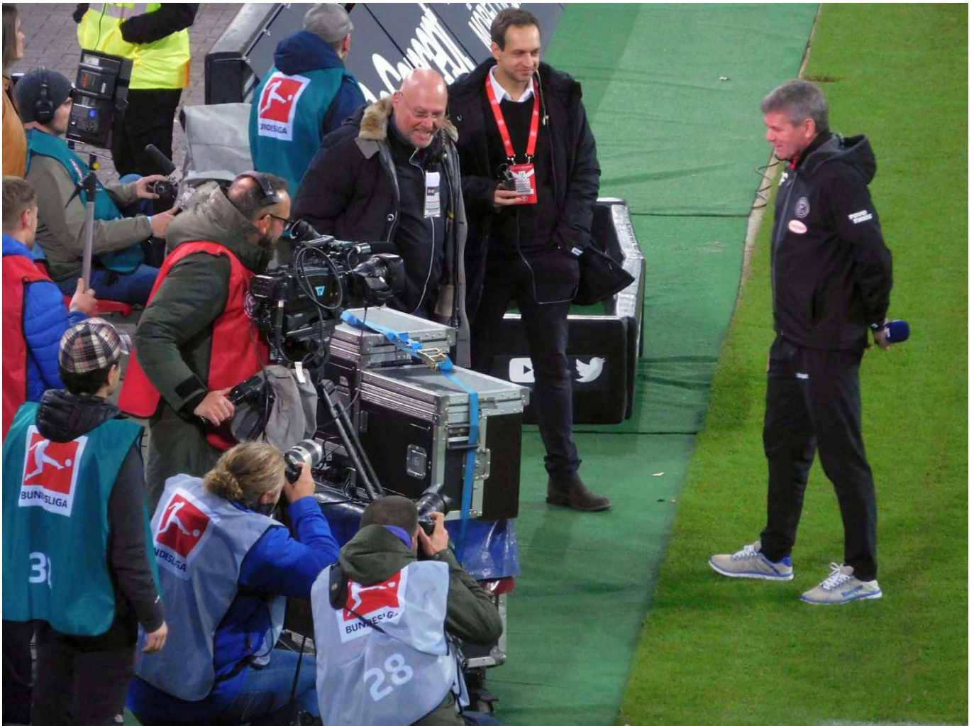
2018: Medienrummel um Funkel

Aufstiegsfeiern auf dem Marktplatz und in der ganzen Altstadt wird niemand vergessen, die:der dabei war. Dann kam der sportliche Misserfolg, dann kam die Entlassung von Friedhelm Funkel, dem F95-Trainer auf den sich bis dahin die gesamte Fanszene hatte einigen können, dann kam der Abstieg und dann kam Corona und damit die Geisterspiele.