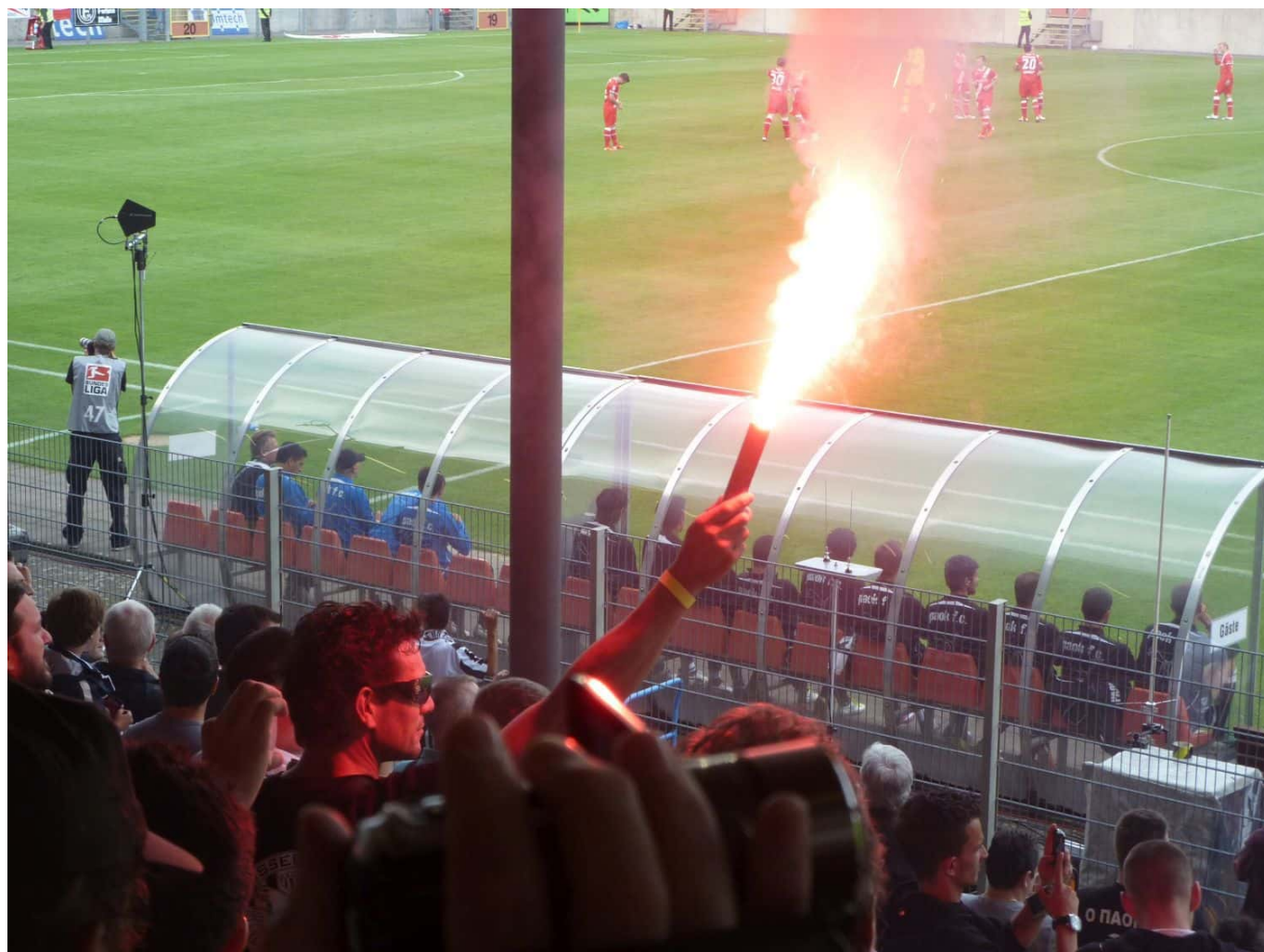
Juli 2011: F95 vs PAOK

vom Verein. Die ersten Fanshops – eröffnet vom HSV und dem Äff-Zeh – gab es erst ab ungefähr 1982. Und dann konnte man dort lediglich offizielle Mützen, Schals und Fahnen erwerben. Wer bis etwa 1980 mit einem Trikot in den Farben des Vereins ins Stadion ging, der besaß eines der Jerseys, die Fußballer manchmal nach dem Abpfiff an Fans verschenkten.