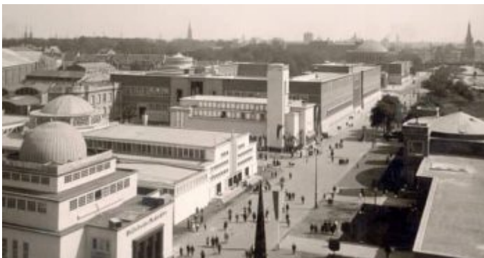
Blick in die Hauptstraße der GeSoLei

Während 1880 knapp 100.000 Menschen in der schönsten Stadt am Rhein lebten, waren es 1902 schon rund 200.000 Bewohner, und 1926 - immerhin erst sieben Jahre nach dem Ende des ersten Weltkriegs - hatte Düsseldorf dann schon um die 430.000 Einwohnern. Das Bevölkerungswachstum hatte seine Ursache einzig und allein in der rasanten Industrialisierung der Stadt mit über 60 Fabriken der stahlverarbeitenden Industrie und Hunderten anderer Industriebetriebe, die Arbeiter brauchten, Arbeiter und nochmal Arbeiter. Mehr als ein Dutzend neuer Stadtviertel waren zwischen 1880 und 1908 auf ehemals landwirtschaftlich genutzten Flächen entstanden, und 1908 und 1909 wurden dann Wersten, Stockum, Lohausen, Rath, Gerresheim, Ludenberg, Eller, Himmelgeist sowie Heerdt einschließlich Oberkassel, Niederkassel und Lörick eingemeindet. Ab 1910 erst galt Düsseldorf als Großstadt - und zwar als eine, die sich einen Teil des Charmes aus der Zeit als Residenzstadt voller Kunst, Musik und Mode bewahrt hatte.