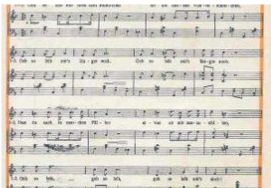
Text und Noten zum GeSoLei-Schlager

Auch in Elsdorf, einer wegen der Zuckerindustrie rasch wachsenden Gemeinde westlich von Bergheim entstand eine Gesolei-Siedlung . Überhaupt: Im weiteren Umkreis von Düsseldorf wurden ab etwa 1928 etliche Siedlungen für Arbeiter gebaut, die den Gesolei-Standards entsprachen. Einige sind erhalten, werden aber heute kaum noch mit der 1926er-Ausstellung in Verbindung gebracht, andere gibt es schlicht nicht mehr. Aber auf der GeSoLei fanden interessierte Besucher jede Menge ganz praktischer Informationen zu der damals noch kaum diskutierten Frage der Hygiene und der allgemeinen Gesundheit. Zum allerersten Mal auf einer solchen Ausstellung wurde zudem der Sport als eigenes Thema behandelt. Überhaupt war die GeSoLei eine große Wundertüte mit Anregungen, Ideen, Vorschlägen und anfassbaren Dingen wie es sie zuvor noch nie irgendwo gegeben hatte.