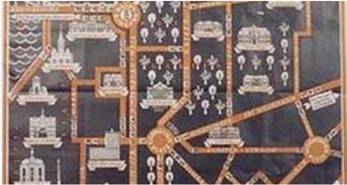
Der Übersichtsplan zur GeSoLei

der Gründerzeit zu einer ernstzunehmenden Industriestadt geworden war.