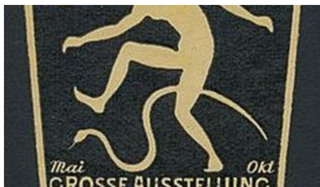
Ein Reklameplakat für die GeSoLei

Nicht selten reden Leute, die sich nicht so gut auskennen, von „Nazi-Architektur“, wenn sie die Bauwerke rund um den Ehrenhof sehen. Und das ist so falsch wie etwas nur falsch sein kann. Tatsächlich entstanden Tonhalle, Rheinterrasse und Ehrenhof für die legendäre Ausstellung GeSoLei im Jahre 1926, durch Düsseldorf in Deutschland, aber auch in Europa und Übersee berühmt machte. Diese Veranstaltung zog in etwas mehr als fünf Monate rund acht Millionen Besucher an und war aus heutiger Sicht dem Optimismus und Fortschrittsglauben der Weimarer Zeit gewidmet. Im Blick hatten die Macher den modernen Menschen, den gesunden, sich und seine Talente verwirklichenden Bürger eines demokratischen Staates. Und weil die Ausstellungsverantwortlichen alle verfügbaren medialen Kanäle auf höchst moderne Weise bedienten, kam Düsseldorf über diesen Sommer auf die Landkarten dieser Welt.