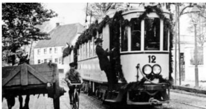
Die Rheinbahn richtete eine eigene Linie G ein (im Bild die D aus jener Zeit)

Rund um die Ausstellung und schon in deren Vorfeld entstanden aber auch eine Reihe Fachdiskussionen, die zum Teil in Form von Aufsätzen und Artikel in der GeSoLei-Zeitung bzw. Zeitschrift erschienen. Die gab es von 1925 bis zum Beginn der GeSoLei. Aber auch die zeitgenössische Kunst war vollkommen integriert, und viele Menschen hatten hier zum ersten Mal die Gelegenheit, diese für sie neue Kunst zu sehen. Und natürlich profitierte Düsseldorf in vielerlei Hinsicht vom gesamten Projekt. Die Rheinbahn hatte eigens die Linie G eingerichtet, die vom Hauptbahnhof bis zum Ehrenhof fuhr. Die heutige Tonhalle war ein Planetarium, eines der ersten in einer Großstadt, das gegen Eintritt für jedermann zugänglich war. Auch die Rheinterrasse wurde nach dem Ende der GeSoLei in den Festivitätenkalender der Stadt integriert. Und natürlich wurde der Ehrenhof und ein Teil der Hallen zur Keimzelle der neuen Messe, die heute längst sie alte Messe ist und deren Grundstücke inzwischen von Ergo-Versicherung für ihre Zwecke genutzt wird.