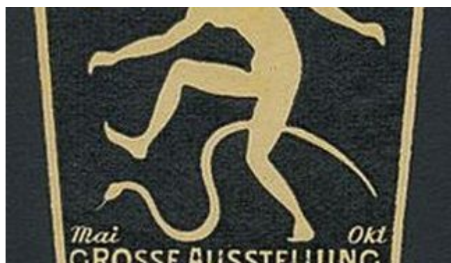
Ein Reklameplakat für die GeSoLei

Nicht selten reden Leute, die sich nicht so gut auskennen, von „Nazi-Architektur“, wenn sie die Bauwerke rund um den Ehrenhof sehen. Und das ist so falsch wie etwas nur falsch sein kann. Tatsächlich entstanden Tonhalle, Rheinterrasse und Ehrenhof für die legendäre Ausstellung GeSoLei im Jahre 1926, durch Düsseldorf in Deutschland, aber auch in Europa und Übersee berühmt machte. Diese Veranstaltung zog in etwas mehr als fünf Monate rund acht Millionen Besucher an und war aus heutiger Sicht dem Optimismus und Fortschrittsglauben der Weimarer Zeit gewidmet. Im Blick hatten die Macher den modernen Menschen, den gesunden, sich und seine Talente verwirklichenden Bürger eines demokratischen Staates. Und weil die Ausstellungsverantwortlichen alle verfügbaren medialen Kanäle auf höchst moderne Weise bedienten, kam Düsseldorf über diesen Sommer auf die Landkarten dieser Welt.