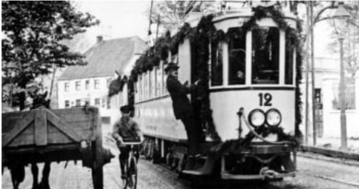
Die Rheinbahn richtete eine eigene Linie G ein (im Bild die D aus jener Zeit)

Rund um die Ausstellung und schon in deren Vorfeld entstanden aber auch eine Reihe Fachdiskussionen, die zum Teil in Form von Aufsätzen und Artikel in der GeSoLei-Zeitung bzw. Zeitschrift erschienen. Die gab es von 1925 bis zum Beginn der GeSoLei. Aber auch die zeitgenössische Kunst war vollkommen integriert, und viele Menschen hatten hier zum ersten Mal die Gelegenheit, diese für sie neue Kunst zu sehen. Und natürlich profitierte Düsseldorf in vielerlei Hinsicht vom gesamten Projekt. Die Rheinbahn hatte eigens die Linie G eingerichtet, die vom Hauptbahnhof bis zum Ehrenhof fuhr. Die heutige Tonhalle war ein Planetarium, eines der ersten in einer Großstadt, das gegen Eintritt für jedermann zugänglich war. Auch die Rheinterrasse wurde nach dem Ende der GeSoLei in den Festivitätenkalender der Stadt integriert. Und natürlich wurde der Ehrenhof und ein Teil der Hallen zur Keimzelle der neuen Messe, die heute längst sie alte Messe ist und deren Grundstücke inzwischen von Ergo-Versicherung für ihre Zwecke genutzt wird.