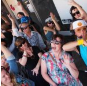
Guru Dudu: Silent Disco Walking Tour