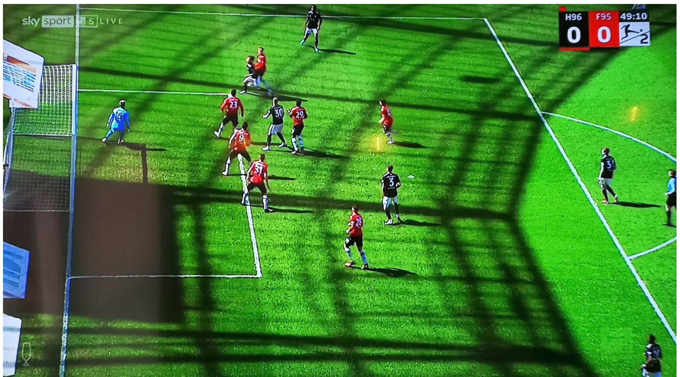
Hannover vs F95: Immer in Unterzahl im 96er-Strafraum

Räume für den Mann mehr zu schaffen; also nicht für einen bestimmten Spieler, sondern immer für einen auf Außen. Mittel der Wahl bei der Herrschaft im Mittelfeld ist der lange Diagonalpass. Außerdem muss die angreifende Mannschaft das Tempo erhöhen und hochhalten. Beides tat die ansonsten glorreiche Fortuna gestern in Hannover nicht – ganz 75 Minuten lang.