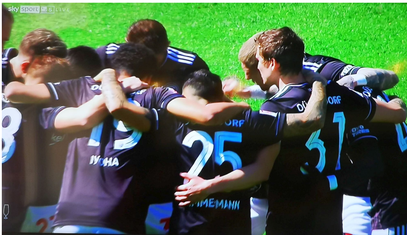
Hannover vs F95: Nein, keine Torjubeltraube, bloß der übliche Motivationskreis