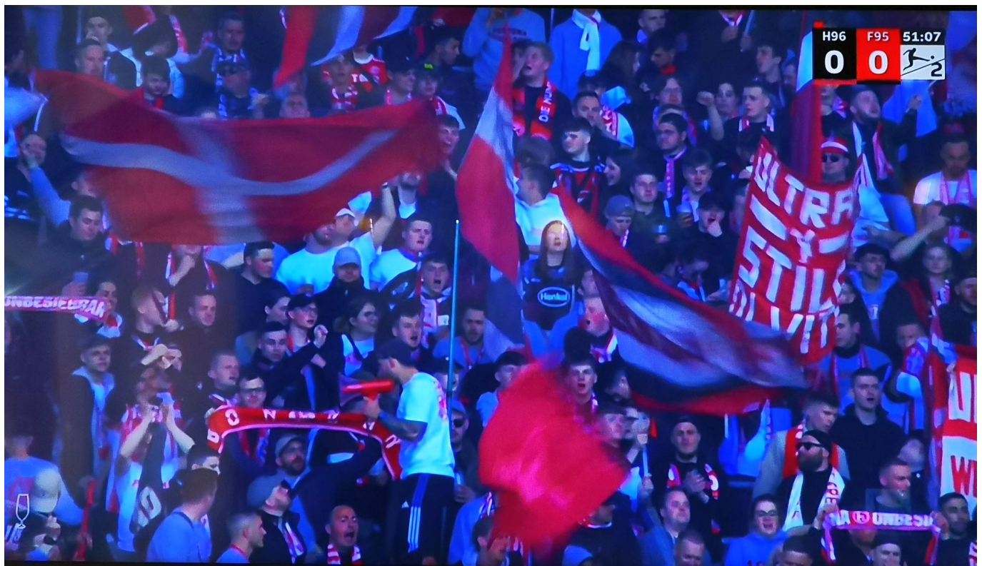
Hannover vs F95: Die besten Düsseldorfener auf dem Platz – die Fans