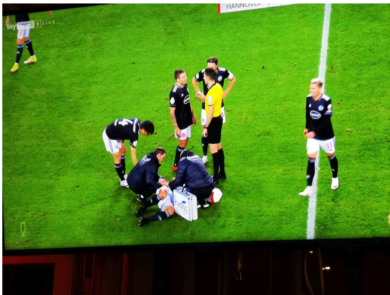
Hannover vs F95: Zwischendurch war das Spiel am Rand einer Klopperei