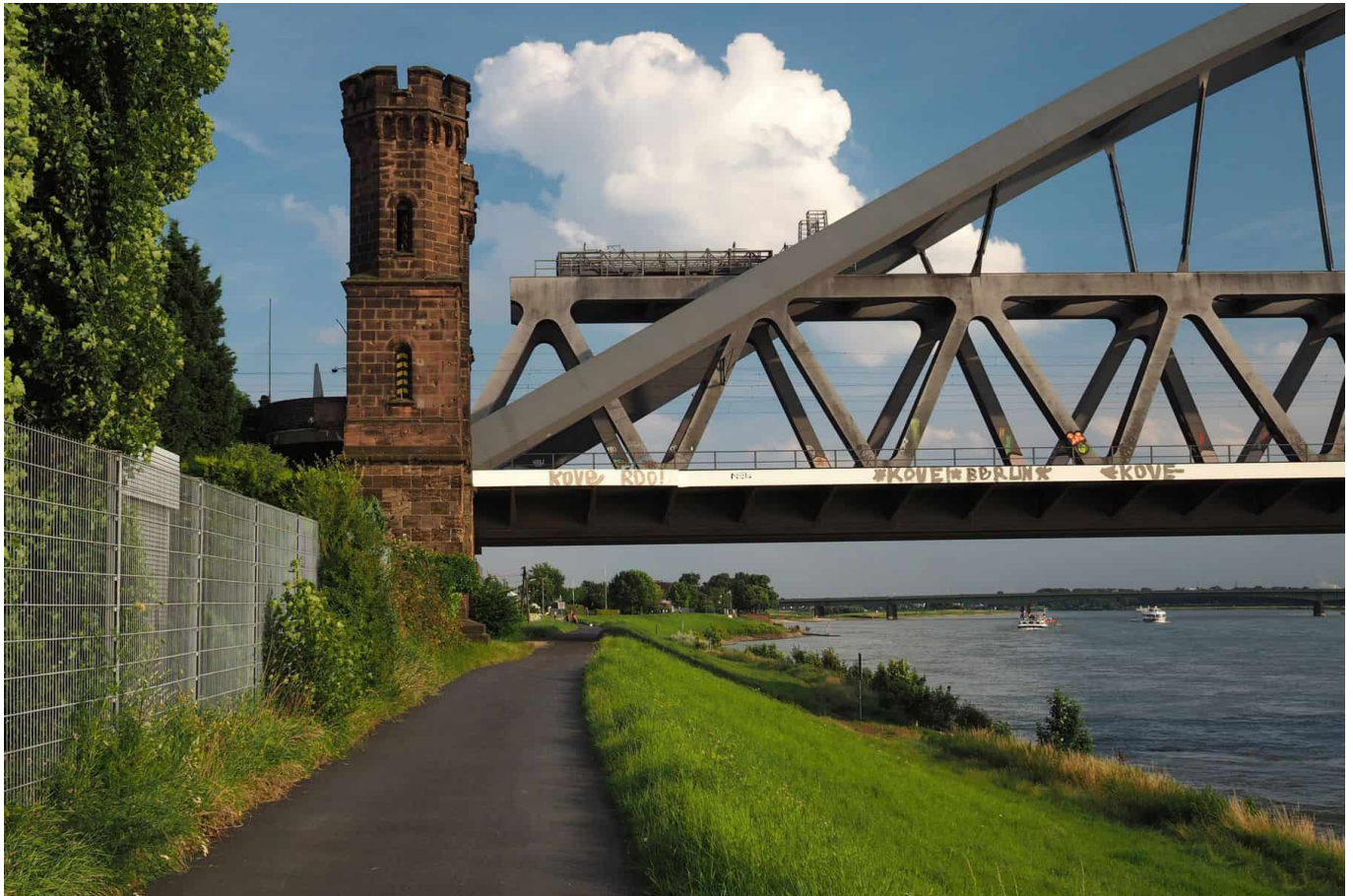
Die Hammer Eisenbahnbrücke vom Rheindeich aus gesehen

Und wieder ein Strand! Vor der Südbrücke liegen eine paar nette Buchten, in denen wirklich nur im Sommer und an Wochenenden was los ist. Hinter der Südbrücke beginnt dann fast schon Volmerswerth. Links vom Fußweg gibt es Äcker ... und sonst nichts. Dann stößt man auf den kleinen, idyllischen Yachthafen, den man umrunden muss, soll es weitergehen. Das letzte Stück Wegs führt dann am Hausboot vorbei, und über die Zufahrt dazu kommt man auf die Uferstraße und zur Haltestelle der Buslinie 726 namens „D-Volmarweg“, dem Endpunkt der zweiten Etappe. Wahlweise kann man auch zur Endhaltestelle der U-Bahn 72 „D-Hellriegelstraße“ gehen.