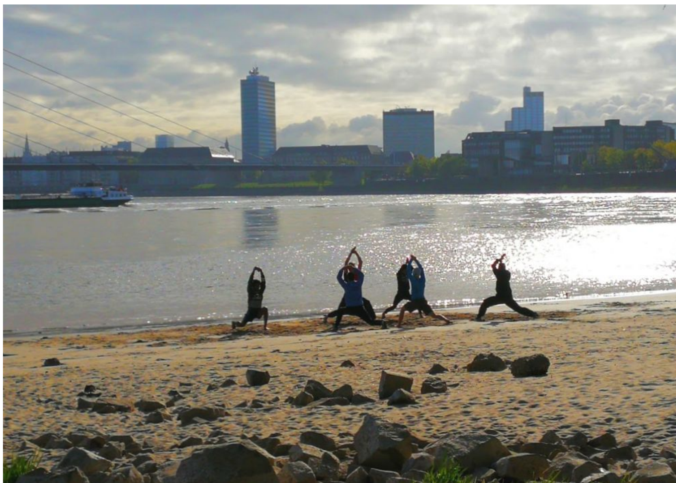
Training am Paradiesstrand

Zuerst passiert man den Golfplatz, der mal der erste „Volksgolfplatz“ Deutschlands war, und umrundet das Gelände des Kraftwerks bis man auf die Ausläufer des Hafens trifft. Oben auf dem Rheindeich wird man je nach Tag und Uhrzeit viele Jogger und Rennradler sehen, denen man unten auf einem schmalen Pfad gut aus dem Weg gehen kann. Unter der Eisenbahnbrücke kommt man dann zum Hammer Hochwassertor. In Hamm bieten sich der „Hammer Blick“ des KCD (sofern gerade geöffnet) oder zwei Büdchen für eine Verpflegungspause an,