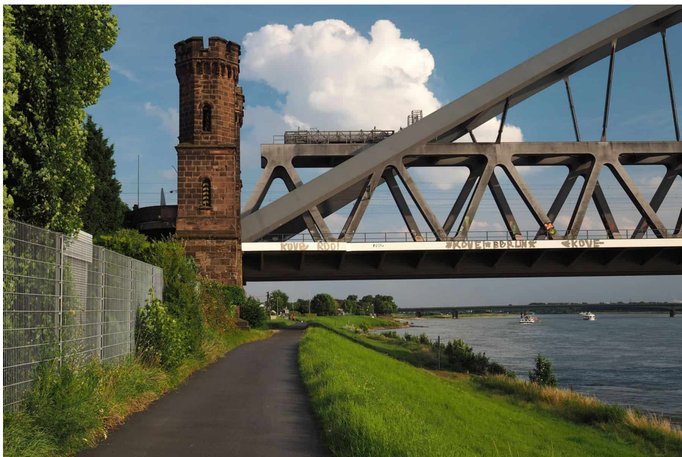
Die Hammer Eisenbahnbrücke vom Rheindeich aus gesehen

Und wieder ein Strand! Vor der Südbrücke liegen eine paar nette Buchten, in denen wirklich nur im Sommer und an Wochenenden was los ist. Hinter der Südbrücke beginnt dann fast schon Volmerswerth. Links vom Fußweg gibt es Äcker ... und sonst nichts. Dann stößt man auf den kleinen, idyllischen Yachthafen, den man umrunden muss, soll es weitergehen. Das letzte Stück Wegs führt dann am Hausboot vorbei, und über die Zufahrt dazu kommt man auf die Uferstraße und zur Haltestelle der Buslinie 726 namens „D-Volmarweg“, dem Endpunkt der zweiten Etappe. Wahlweise kann man auch zur Endhaltestelle der U-Bahn 72 „D-Hellriegelstraße“ gehen.