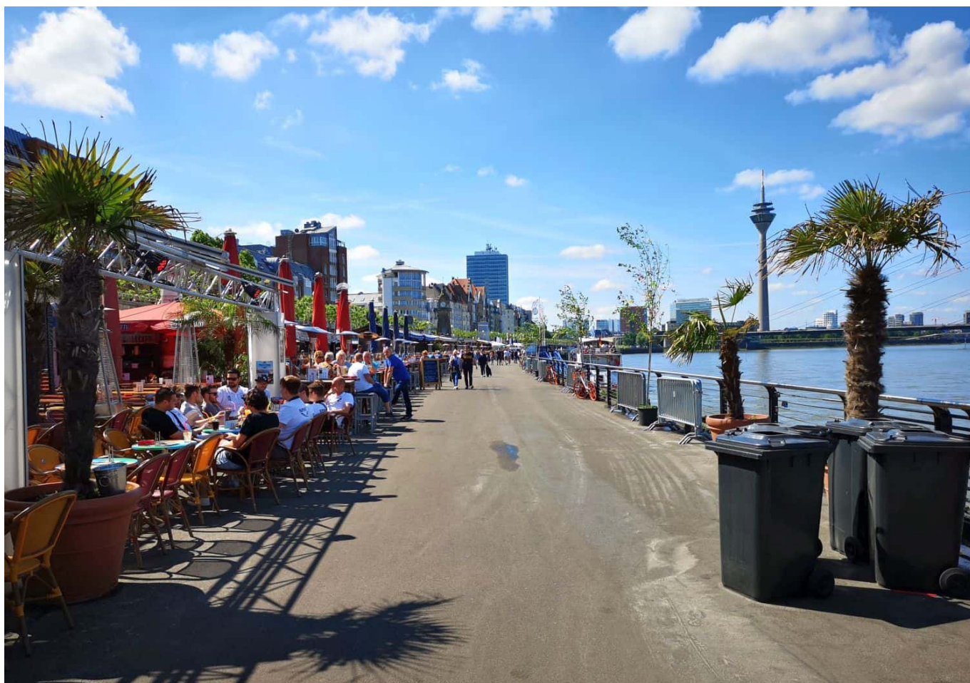
Unteres Rheinwerft

Der eigentliche Weg findet sich weiter auf dem unteren Rheinwerft, wo man die Kasematten und die Anlegestellen der KD und der Weissen Flotte passiert. Kurz vor der Rheinkniebrücke liegt dann der dritte Stadtstrand an der Apollowiese. Die heißt so, weil das Varieté Apollo direkt unter der Brücke am Ende dieser dreieckigen Wiese liegt. Das war's dann auch schon mit dem Altstadtufer. Alternativ kann man natürlich auch oben über die Rheinuferpromenade flanieren und weiter am Landtag und dem Rheinturm vorbei. Kenner bevorzugen es, weiter am Fluss entlang an'm Apollo und am Landtag vorbeizuwandern.