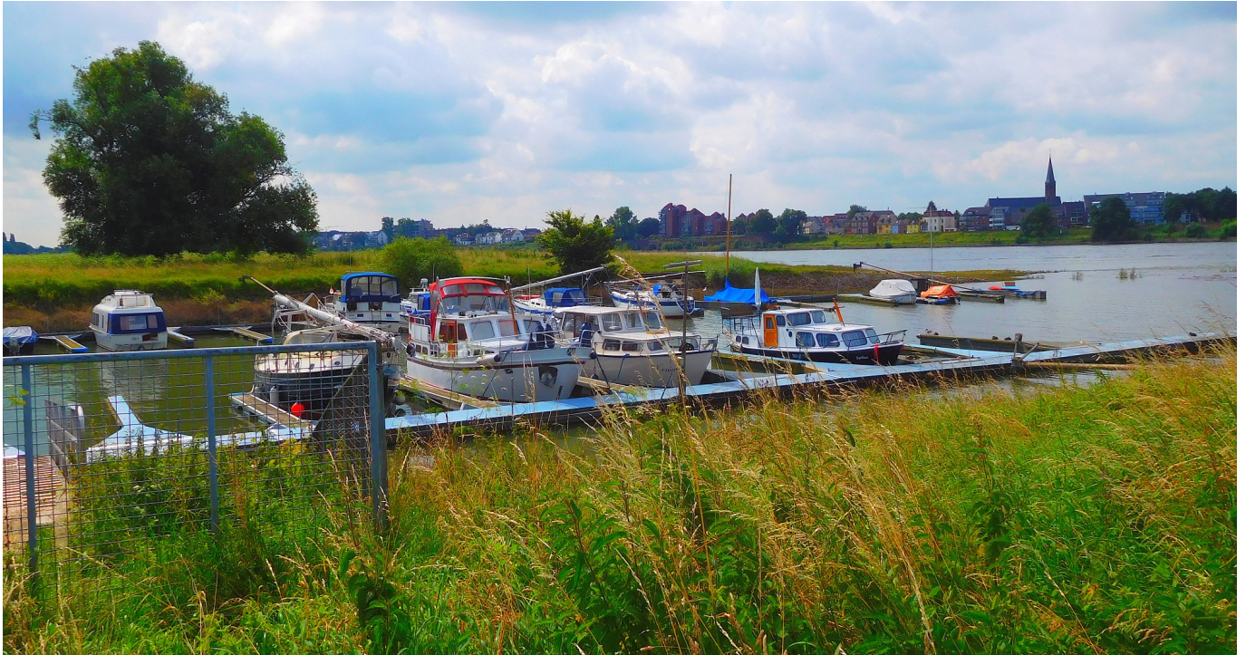
Der kleine Yachthafen bei Volmerswerth

Bis dahin liegen gut 12,5 Kilometer Wanderstrecke hinter einem, auf der man den Rhein begleitet, die Altstadt von unten sowie Hamm und Volmerswerth von vorne erlebt hat.