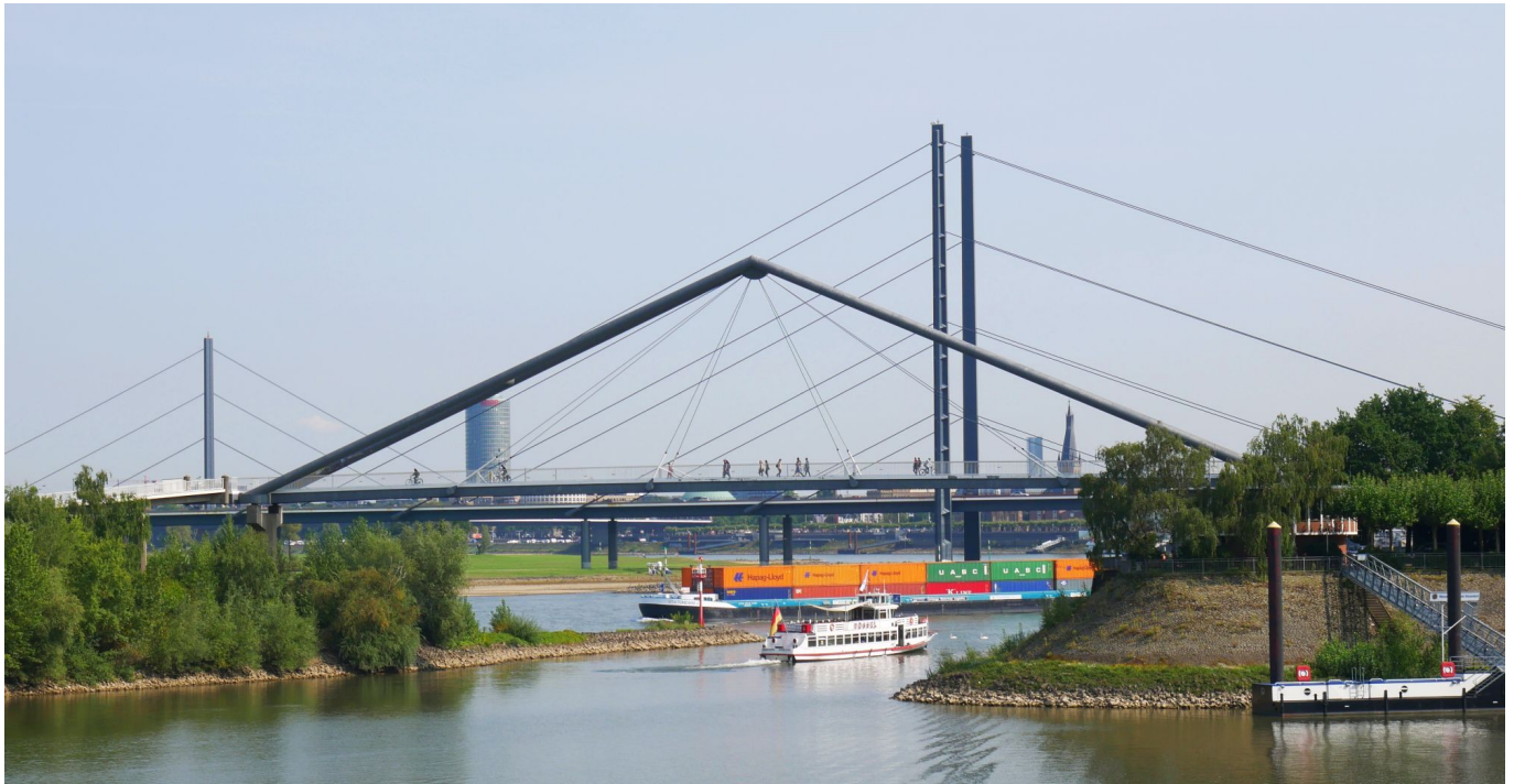
Fußgängerbrücke über die Hafeneinfahrt

Zwischen dem Landtag und der Fußgängerbrücke, die auf die Lauswar führt, sieht man den alten Hafenkran. Linkerhand öffnet sich der Blick auf den Medienhafen, beginnend mit dem WDR-Gebäude an der Marina. Auch die Gehry-Bauten werden sichtbar. Die Brücke führt auf den Rheindeich oberhalb des Paradiesstrandes. Endlich Strand! möchte man ausrufen, und geht natürlich hinab bis ans Wasser. An heißen Sommertagen tobt hier das echte Strandleben, im Herbst und Winter trifft man kaum je einen Menschen. Am Ende des Paradiesstrandes beginnt dann die eigentliche Lausward, an deren zum Rhein gelegenen Rand man nun bis zur Hammer Eisenbahnbrücke marschiert.