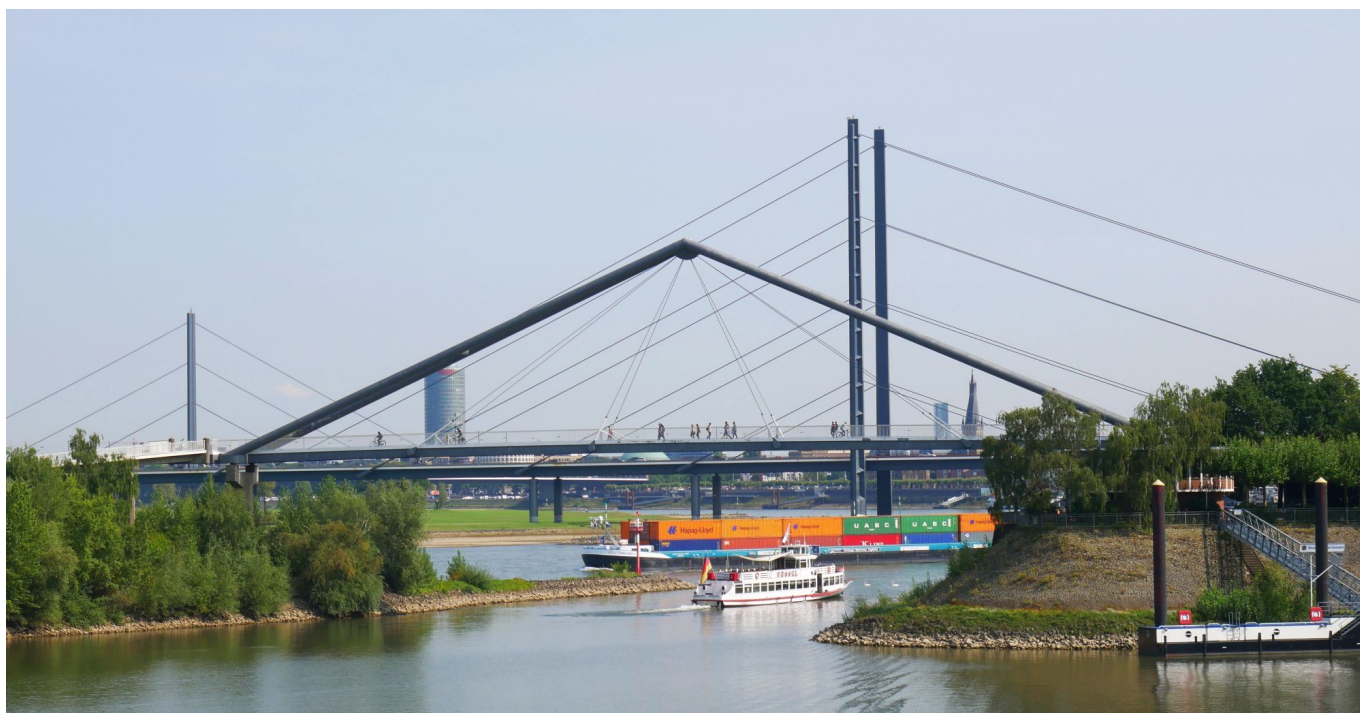
Fußgängerbrücke über die Hafeneinfahrt

Zwischen dem Landtag und der Fußgängerbrücke, die auf die Lauswar führt, sieht man den alten Hafenkran. Linkerhand öffnet sich der Blick auf den Medienhafen, beginnend mit dem WDR-Gebäude an der Marina. Auch die Gehry-Bauten werden sichtbar. Die Brücke führt auf den Rheindeich oberhalb des Paradiesstrandes. Endlich Strand! möchte man ausrufen, und geht natürlich hinab bis ans Wasser. An heißen Sommertagen tobt hier das echte Strandleben, im Herbst und Winter trifft man kaum je einen Menschen. Am Ende des Paradiesstrandes beginnt dann die eigentliche Lausward, an deren zum Rhein gelegenen Rand man nun bis zur Hammer Eisenbahnbrücke marschiert.