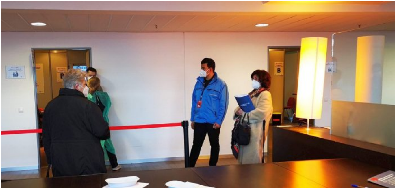
Impfzentrum Düsseldorf: Die Warteschlange vor den Impfkabinen

Da sie gerade keinen Impfstoff parat hat, plaudern wir ein bisschen. Auch sie sagt, dass alle Kandidat*innen bis auf wenige Ausnahmen sehr geduldig und freundlich reagieren. Ich werfe einen Blick aus dem Fenster auf die leere Arena mit den Presseplätzen genau gegenüber. Dann bringt man ihr zwei aufgezogene Spritzen. Ich soll mich für einen Arm entscheiden. Dann um 19:35 Uhr: „So, jetzt kommt’s. Bitte lächeln.“ Ich spüre den Einstich gar nicht. Pflaster drauf, und ich kann gehen. Etwas weiter auf der Etage sind drei weitläufige Ruhebereiche eingerichtet. Es wird empfohlen, dort 20 bis 25 Minuten zu warten, um sicher zu gehen, dass man die Injektion gut vertragen hat. Hier ist eine Sanitätsstation für Notfälle untergebracht.