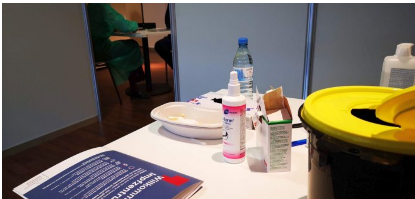
Impfzentrum Düsseldorf: In der Impfkabine – mit Blick ins Arenainnere