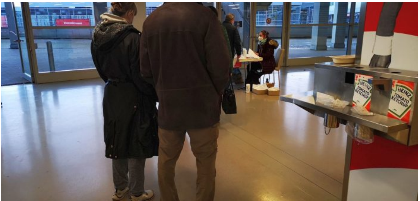
Impfzentrum Düsseldorf: Die Formularausgabe

Wir wurden nun auf dem Südplateau einmal bis zu den Eingängen des Umlaufs direkt hinter den Stehplätzen geleitet. Dort treffe ich gegen 18:50 ein. An einem Tisch sitzen zwei nette junge Damen, die Formulare an die Impflinge verteilen und Tipps zum Ausfüllen geben. Im Prinzip bekommt man dort auch einen Kugelschreiber, aber darauf müssen wir kurz warten. „Aus irgendeinem Grund nehmen viele Leute die Billig-Kulis einfach mit“, gibt die eine Frau an, „obwohl überall Schalen stehen, in die man den benutzten Kuli legen soll. Denn die werden desinfiziert und dann wieder in den Kreislauf gespeist.“ Der Papierkram erweist sich als dramatisch altmodisch, also vollständig nicht-digital. Man muss tatsächlich drei Formblätter in doppelter Ausfertigung von Hand ausfüllen – irgendeine Lösung mit QR-Codes und Smartphones gibt es nur in Ländern ohne Digitalnotstand.