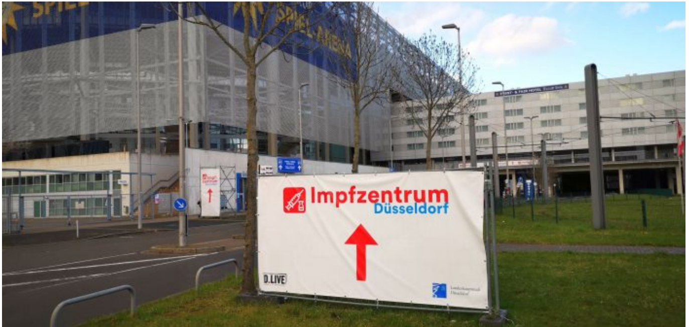
Impfzentrum Düsseldorf: Alles perfekt beschildert

Hier werden sowohl die Leute in den Autos als auch die Fußgänger zum ersten Mal überprüft; nur wer eine Terminbestätigung vorweisen kann, kommt weiter. Den motorisierten Besuchern werden dann vom Servicepersonal Parkplätze direkt an der Arena zugewiesen. In einem Bericht der RP-Online vom Vortag beschwerte sich ein Impfling, er und seine Frau hätten eine halbe Stunde im Schneeregen warte müssen, es sei schlecht organisiert gewesen, sie seien wieder nach Hause gefahren. Darauf angesprochen berichtete der Gruppenleiter der Parkwächter, das Problem sei entstanden, weil die Mehrheit der Besucher viel zu früh, teilweise anderthalb Stunden vor ihrem eigentlichen Termin, gekommen seien. Da habe es dann einen Stau gegeben.