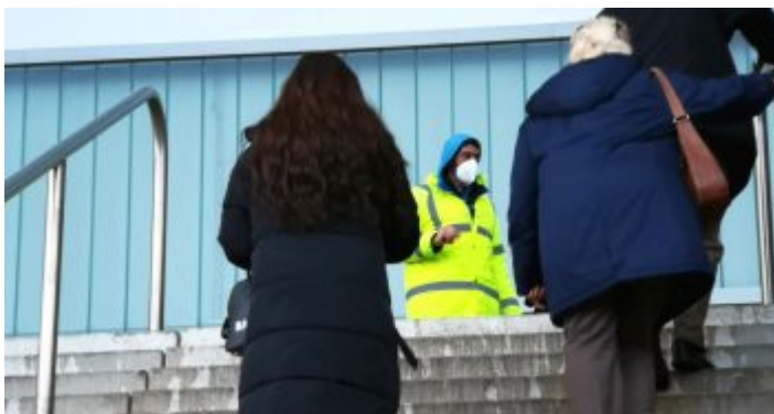
Impfzentrum Düsseldorf: Der Aufstieg zum

Hier werden sowohl die Leute in den Autos als auch die Fußgänger zum ersten Mal überprüft; nur wer eine Terminbestätigung vorweisen kann, kommt weiter. Den motorisierten Besuchern werden dann vom Servicepersonal Parkplätze direkt an der Arena zugewiesen. In einem Bericht der RP-Online vom Vortag beschwerte sich ein Impfling, er und seine Frau hätten eine halbe Stunde im Schneeregen warte müssen, es sei schlecht organisiert gewesen, sie seien wieder nach Hause gefahren. Darauf angesprochen berichtete der Gruppenleiter der Parkwächter, das Problem sei entstanden, weil die Mehrheit der Besucher viel zu früh, teilweise anderthalb Stunden vor ihrem eigentlichen Termin, gekommen seien. Da habe es dann einen Stau gegeben.