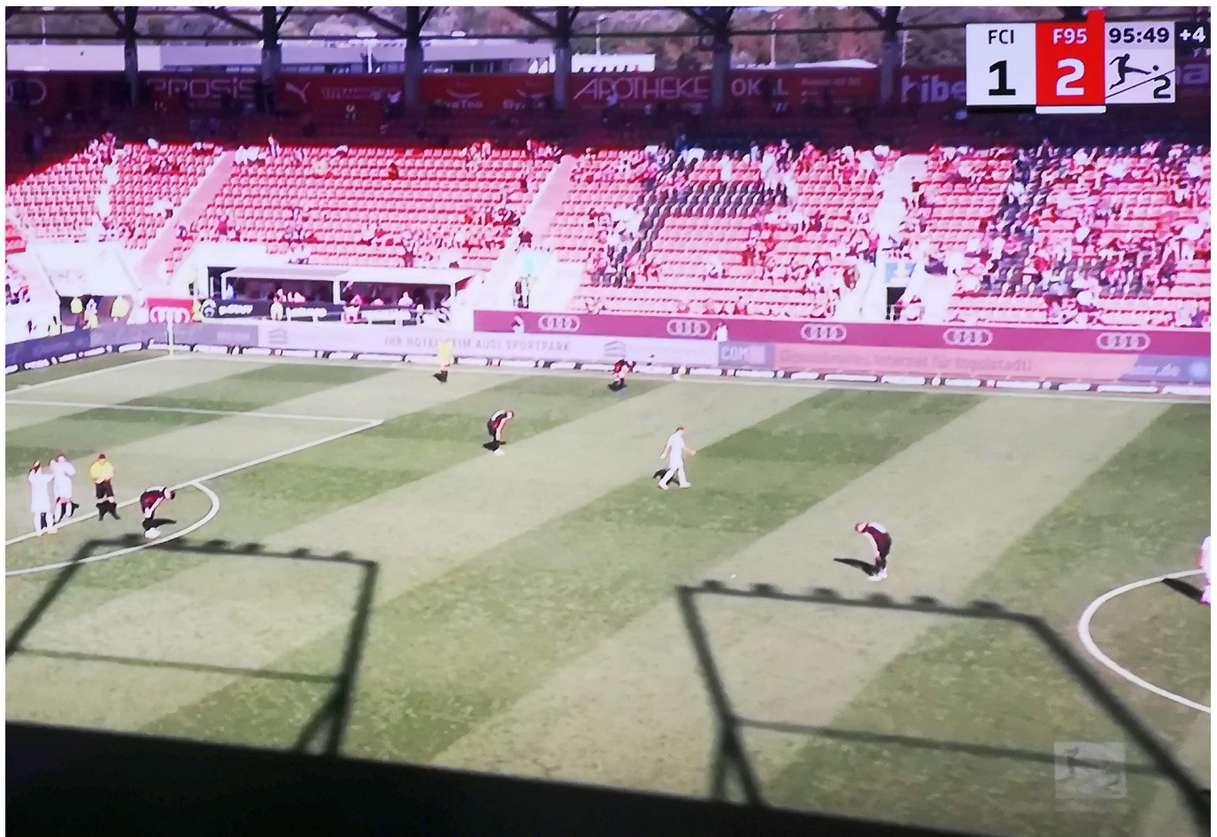
Ingolstadt vs F95: Das Ende ohne Schrecken