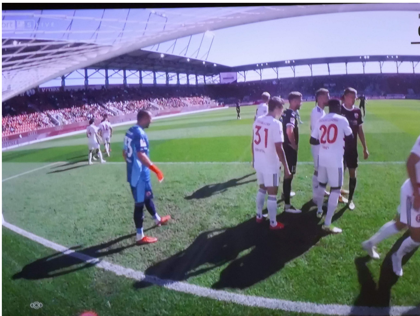
Ingolstadt vs F95: Ecke für die Ingos