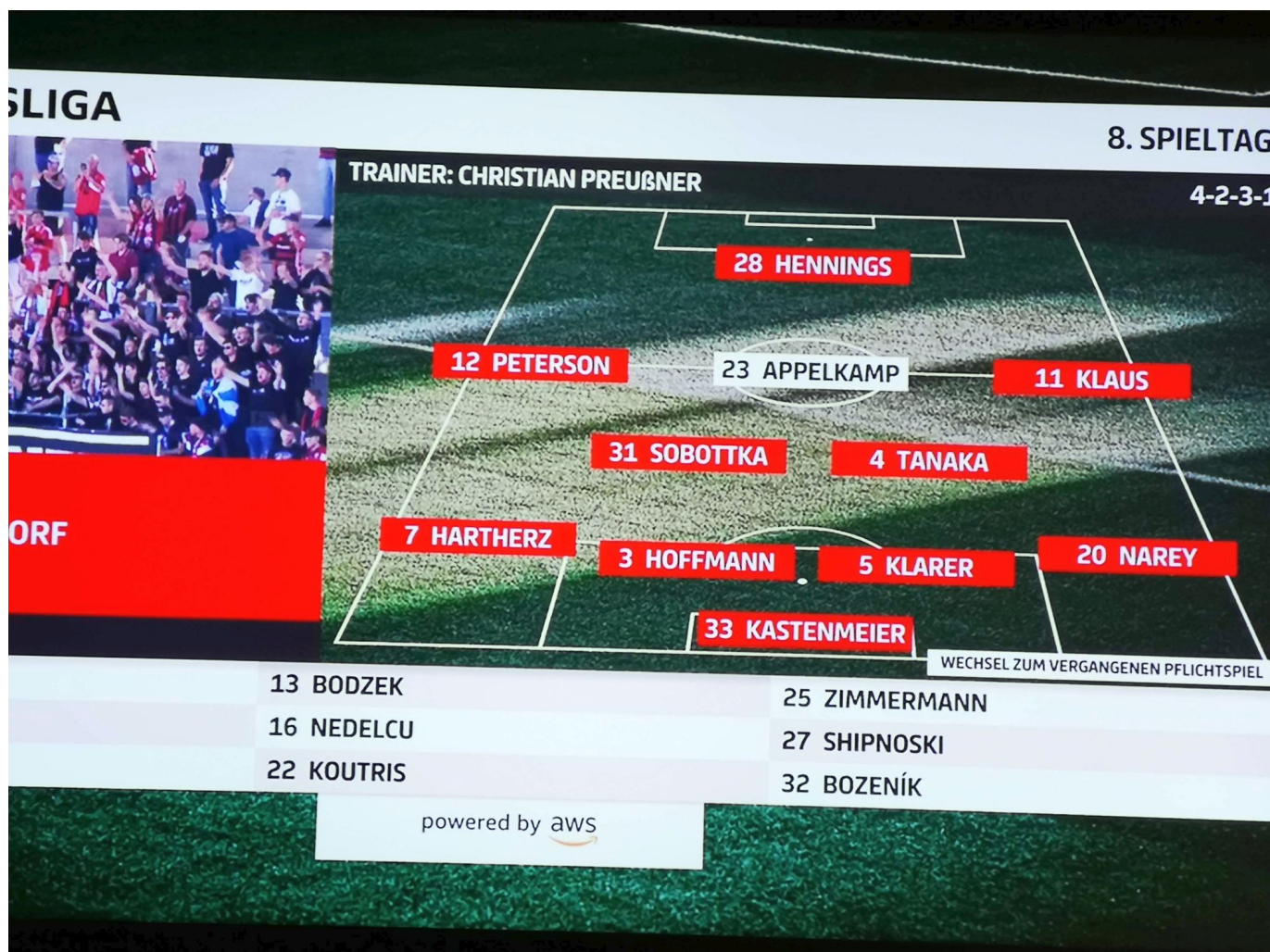
Ingolstadt vs F95: Die nicht ganz unerwartete Startaufstellung

Das alles ist selbst für derart schwache Gegner wie Ingolstadt (und zuvor auch schon Aue und Sandhausen) dermaßen berechenbar. Und weil es außer Flanken keine Schüsse Richtung Ingo-Tor gab, war die Bilanz zur Pause erschreckend. Denn zu den wenigen Schüssen aufs Tor kam erneut eine Passquote von knapp über 75 Prozent und ein Manko bei der Zweikampfquote. Außerdem lag die Laufleistung trotz um die 55 Prozent Ballbesitz deutlich unter der des Gegners.