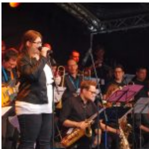
Bigband der Clara-Schumann-Musikschule

Wenn aber der Funk zum Jazz gehört, dann brachte eine Truppe namens „Rhythmusportgruppe“ eine gehörige Portion Bewegungs-Jazz auf die Bühne am Marktplatz. Die Herren und die Damen waren sportlich gekleidet und funkten los wie die wilde Jagd. Weil das Publikum rund um das Pferd vom Jan Wellem aber eher auf die Fressstände gepolt war, hielt sich das Zappeln der Zuhörer in engen Grenzen. Da gab es vor dem Konzertzelt am Burgplatz dann schon lange Schlangen. Angesagt war ein Herr „Seven“, der neuerdings total bekannt ist, weil er beim Xavier Naidoo seine Musikerkollegen-Show an der Zeit von u.a. dem kölschen BAP-Niedecken singen durfte. Da stürmte das Volk an die Gitter der ersten Reihe, und alle waren super fröhlich. Das nahm der Schweizer Musiker mit seiner sehr funkigen Band gern auf und begann gleich mit solchen Spielen, dass die Leute „Oh-ho“ oder so grölen sollten. Deswegen waren viele auch mit Kind und Kegel da, und irgendwer war gerade immer unterwegs zum Bierholen.