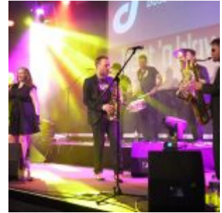
Beat 'n Blow im Henkelsaal

Dann begannen die Junggesellenabschiede, Kegelclubausflügler und sonstige Testosterongeschwader die Altstadt zu fluten, deren Mitglieder schon von diesem eichgespülten tanzbaren Jazz heillos überfordert waren und nicht wussten, ob sie das lustig finden oder sich lustigmachen sollten. Da schienen zwei Gigs an der Ratinger Straße eine gute Alternative. Im Stone, dem Club an der Stelle des legendären Ratinger Hofes, traten die „Jazzinvaders“ auf, eine Band gesetzter Funk-Herren samt mittelalter Dame im kurzen Glitzerkleidchen. Die passten gerade mal so auf die Bühne, waren dann aber erstaunlich jazzig – um das bewusste Adjektiv mal wieder zu verwenden. Das Publikum auf den heißen 200 Quadratmeter bestand zur Hälfte aus Stammgästen, die das Gebotene nahmen, wie es kam, und Jazz-Rally-Passanten, die sich nur teilweise wohlfühlten in diesem Ambiente.