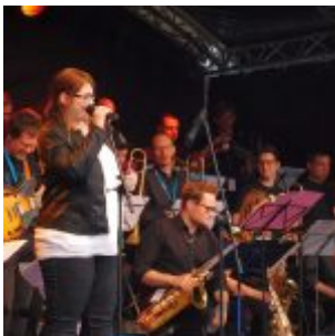
Bigband der Clara-Schumann- Musikschule

Wenn aber der Funk zum Jazz gehört, dann brachte eine Truppe namens „Rhythmusportgruppe“ eine gehörige Portion Bewegungs-Jazz auf die Bühne am Marktplatz. Die Herren und die Damen waren sportlich gekleidet und funkten los wie die wilde Jagd. Weil das Publikum rund um das Pferd vom Jan Wellem aber eher auf die Fressstände gepolt war, hielt sich das Zappeln der Zuhörer in engen Grenzen. Da gab es vor dem Konzertzelt am Burgplatz dann schon lange Schlangen. Angesagt war ein Herr „Seven“, der neuerdings total bekannt ist, weil er beim Xavier Naidoo seine Musikerkollegen-Show an der Zeit von u.a. dem kölschen BAP-Niedecken singen durfte. Da stürmte das Volk an die Gitter der ersten Reihe, und alle waren super fröhlich. Das nahm der Schweizer Musiker mit seiner sehr funkigen Band gern auf und begann gleich mit solchen Spielen, dass die Leute „Oh-ho“ oder so grölen sollten. Deswegen waren viele auch mit Kind und Kegel da, und irgendwer war gerade immer unterwegs zum Bierholen.