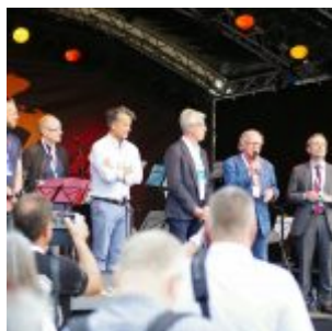
Eröffnung mit Doldinger und