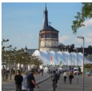
Promenade und Zelt

Am Ende des Freitags fragte sich der geneigte Besucher der Jazz-Rally, ob man die Veranstaltung nicht einfach in Funk-Soul-Groove-Rally umbenennen sollte, denn außer den unentwegten Dixie-Band-Burschen versuchten alle Musikanten irgendwie das Publikum zum Grooven zu bewegen. Auf der Bühne am Marktplatz wurden alle Acts mit der Prognose versehen, sie würden zum Tanzen animieren und zum Schwitzen bringen. Und das Abend-Highlight, der New-Soul-Sänger Seven fragte zu Beginn seines Konzerts „Oder ist das zu viel Funk für ein Jazz-Festival?“. Das erlebnishungrige und nicht besonders jazz-affine Publikum jubelte mit einem lauthalsen „Nein!“ und schwang die Hände im vorgegebenen Groove über den Köpfen. Selbst die eigentlich klassisch aufgestellte Bigband der Clara-Schumann-Musikschule bemühte durchweg tanzbare Rhythmen. Da waren dann die Jazzinvaders im Stone (Ratinger Hof) schon beinahe die jazzigsten der Jazzler. Wobei das Adjektiv „jazzig“ manches Gespräch zitierte. Es scheint inzwischen zu reichen, die eigene Mucke „jazzig“ anfühlen zu lassen, um sich selbst als Jazz-Musiker zu betrachten. Wohlgermerkt: Das alles ist weder eine Generalkritik an den auftretenden Künstlern, noch der Versuche, eine Debatte über die Frage zu starten „Was genau ist denn eigentlich Jazz?“