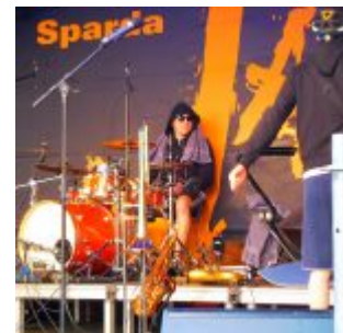
Jazz-Rally 2016: die Rhythmusgruppe auf der Bühne auf dem Marktplatz

Bis dahin hatten die Programmierer, die ja ohnehin eher aus dem Dunstkreis des Pop kommen, weite Bereiche der Jazz-Landschaft und -Historie großräumig umfahren und ein Bouquet zusammengestellt, in dem so ungefähr jede Jazz-Richtung zwischen den mittleren 30ern- und den 50er-Jahren komplett fehlte. Kein Swing, kein Cool, kein Bebop... Immerhin konnte das Publikum dann im prallgefühlten Juta ein blutjunges Trio namens „Turn“ begutachten, das tatsächlich Ernst machte mit dem Jazz und gar nicht erst versuchte, die Zuhörer zu irgendwas zu animieren. Die drei Burschen spielten ihre selbstgeschriebenen Stücke, die so ziemlich das repräsentierten, was gute zeitgenössische Jazz-Trios (wie Medeski, Martin & Wood oder auch The Bad Plus) anbieten. Dabei übertraten sie mehrfach die rote Linie zu den freien Formen, was aber in Relation zum dauernden „Do you feel good“ draußen eine Wohltat war.