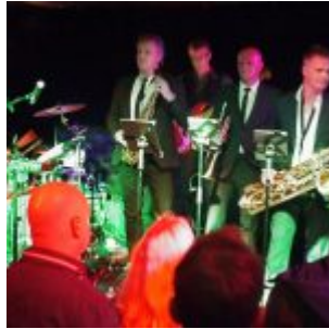
Jazzinvaders im Stone (Ratinger Hof)