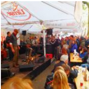
TBQ am Uerige

Ragtime Band“, ein Club älterer Herren, die im Carschhaus-Pavillon sehr traditionell schrammelte und niemanden zum Tanzen aufforderte. Rund um den Bierwagen hatten sich ein paar Hundert Menschen versammelt und ließen es sich bei Getränk und Geräusch gutgehen.