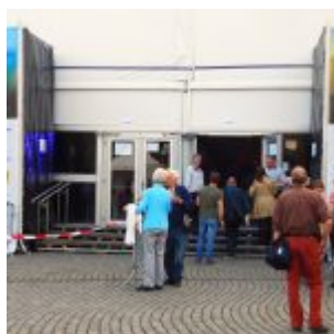
Eingang zum Konzertzelt