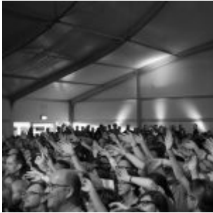
Zuschauer bei Seven