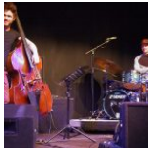
Turn Trio im Juta