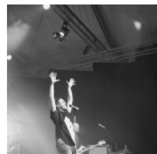
Seven im Konzertzelt