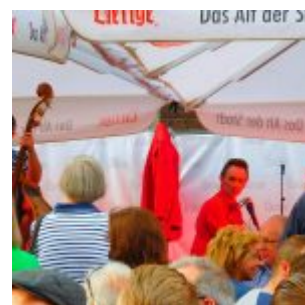
Boogie am Uerige