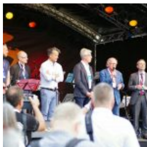
Eröffnung mit Doldinger und