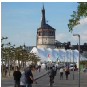
Promenade und Zelt