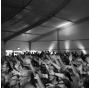
Zuschauer bei Seven