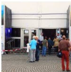
Eingang zum Konzertzelt