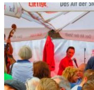
Boogie am Uerige