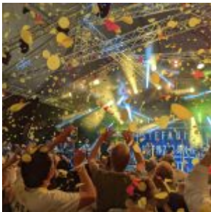
Jazz Rally 2022: Konfettiregen im Zelt bei Stefanie Heinzmann

Ganz, ganz viele Zuhorende waren mit dem Oeuvre der Sangerin eh nicht vertraut und waren mehr oder weniger aus Neugierde gekommen. Vermutlich hat Stefanie Heinzmann nach diesem grandiosen Auftritt ein paar Hundert Fans mehr. Das liegt nicht nur an ihrem Gesangkonnen, sondern an allem, was sie singend und fast immer tanzend ausstrahlt. Da wirkt nichts inszeniert oder auf Showeffekt geburstedt, das kommt einfach ehrliche, emotionale Musik irgendwo aus dem Umfeld des Planeten R'n'B. Wobei: Als nach ein paar Songs zwei Monsterkonfettikanonen das Publikum mit ubergroen Papierkreisen uschuttete, war auch die Freude der Anwesenden gro.,