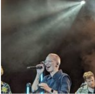
Stefanie Heinzmann und ihre wunderbare Stimme