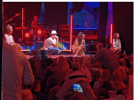
Jan Delay fordert „Hinsetzen!“