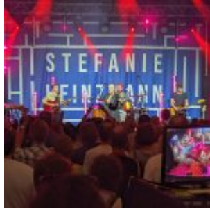
Stefanie Heinzmann: Kleine Sangerin auf groer Buhne