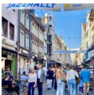
Am Sonntag auf der Kurzestraße

Magnet war und so die Rally-Besucher immer wieder anzog, um ein extrem abwechslungsreiches Programm zu genießen. Stattdessen hatte man eine Bühne auf dem Schadowplatz aufgebaut, was zumindest am Freitag und Samstag nicht so gut kam. Die Einkaufsfestung Kö-Bogen im Rücken und die Shopping-Massen auf der Schadowstraße vor sich, war es für die Musikant:innen oft nicht leicht, das Publikum auf der Insel dazwischen zu erreichen. Das ging vor drei Jahren mit der Bühne an der Johanneskirche deutlich besser.