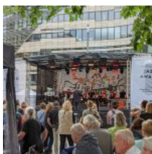
Open-Air-Bühne vorm Kö-Bogen