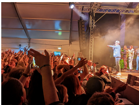
Jan Delay: Noch mit Jackett

Jan Philipp Eißfeldt ist eine Rampensau der besonderen Sorte, festivalerfahren und mit allen Wassern der Publikums motivation gewaschen. Das war schon in den ersten Minuten seines Auftritts vor der genialen Band mit dem blöden Namen Disko No. 1 und den fantastischen Background-Sängerinnen, die als Deladys firmieren müssen, zu spüren. Erstens nahm er gefühlt zehnmal das Wort „Düsseldorf“ in den Nuschelmund, zweitens erwähnte er mehr als beiläufig, dass er die Tage zu vor bei Rock im Park und Rock am Ring (dort vor 40.000 Menschen) aufgetreten sei und sich frage, ob das Düsseldorfer Publikum ihm ein „Rock in Düsseldorf“ bescheren könne.