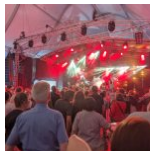
Jungle by Night im Zelt