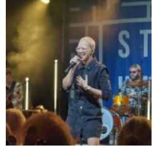
Stefanie Heinzmann hat sich sehr gefreut