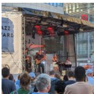
Entdeckung: Moody Monks auf dem Schadowplatz

Womit wir aber schon bei der Entdeckung dieser Jazz Rally sind: Am Samstag nahm die düsseldorferisch-kölsche Band Moody Monks die Menschen am Kö-Bogen anderthalb Stunden lang gefangen – ein hochmusikalische Truppe mit einer fantastischen Sängerin, tollem selbstverzapftem Material und großer Bühnenpräsenz. Da verpasste mancher Rally-Gast sogar das Vorkonzert von Jeff Cascaro im Zelt.