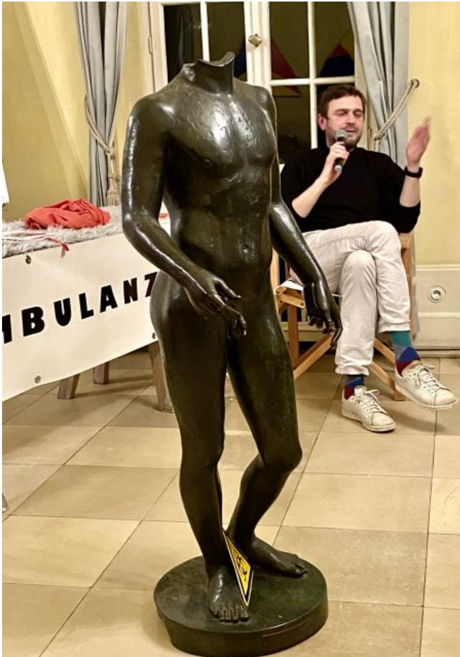
Der kopflose Bronzejüngling aus dem Malkasten-Fundus

Fotograf Westermeier, nach seiner Einstellung zu Online-Dialogen befragt, sagt für sich nüchtern: „Manchmal liebe ich es, manchmal find ich es doof, manchmal nehme ich es einfach hin.“ Er fragt sich aber auch, ob Empathie und Emotion dabei vielleicht auf der Strecke bleiben könnten: „Wenn ich irgendetwas sage, was eine Person verletzen könnte, das