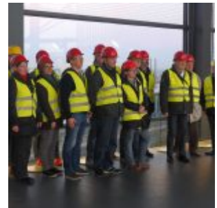
Die glückliche Besuchergruppe