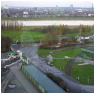
Blick auf die Einfahrt zum Kraftwerksgelände