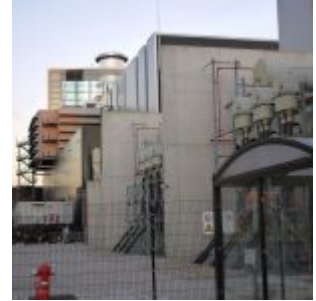
Block Fortuna im Hintergrund