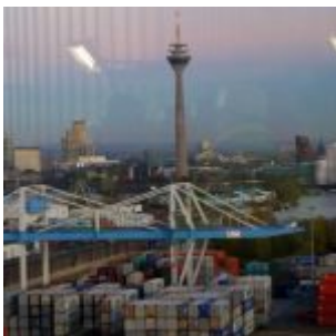
Blick über die Stadt