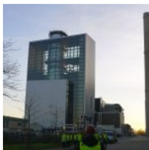
Deutschlands schönstes Kraftwerk: Block Fortuna auf der Lausward

Seit er da steht auf der Lausward, bin ich fasziniert vom Block Fortuna des Kraftwerks der Stadtwerke. Für mich ist dieses Gebäude das schönste Kraftwerk Deutschlands und passt in jeder Hinsicht bestens zur schönsten Stadt am Rhein. Nun verpflichtet der Begriff „Kraftwerk“ in Düsseldorf aber auch alle Verantwortlichen zu besonderen Entscheidungen. Immerhin hat die weltgrößte Band der elektronischen Musik sich genau nach dieser Stromerzeugungsfabrik