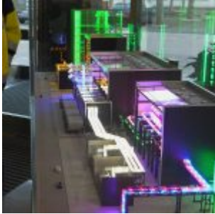
Das Modell, bunt illuminiert