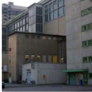
Die alten Blöcke