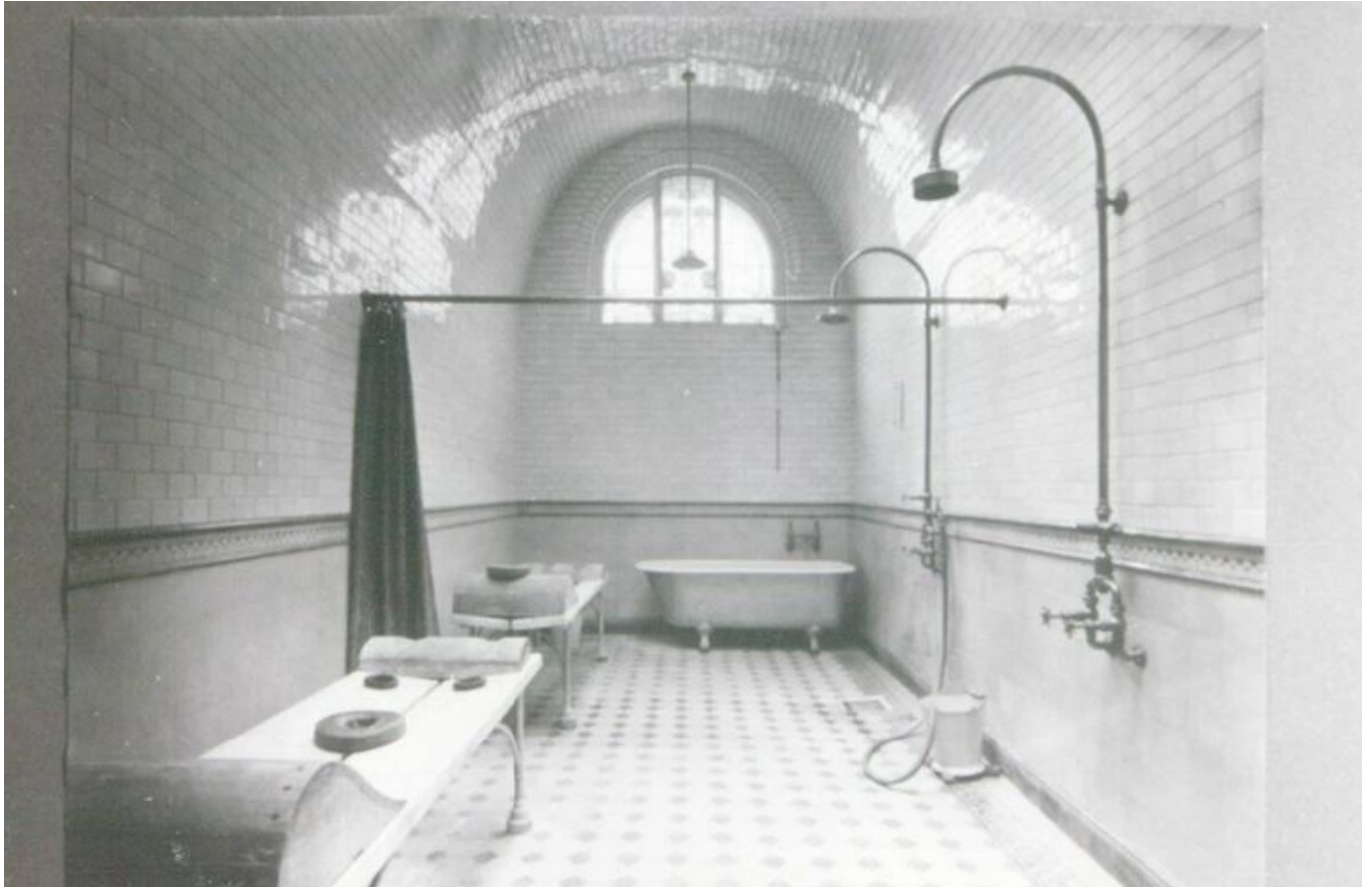
So sahen die Wannenbäder früher aus

Hauptmotiv dafür, eine Badenanstalt zu bauen, war daher nicht irgendetwas mit Sport, sondern allen Teilen der Bevölkerung ein wöchentliches Wannenbad zu erlauben. Also nahmen beim Bau des Münsterbads die Kabinen mit den Badewannen und die Gemeinschaftsduschen den größten Raum ein. Die Menschen, die in Rath, Derendorf und Pempelfort lebten, waren begeistert. Endlich konnten sie sich – und das für ein paar Pfennige Gebühr – nach dem Motto „Ein Bad pro Woche für jeden Deutschen“ in der Münsterstraße gemütlich in eine Wanne legen und den Arbeitsdreck der Woche abwaschen. Dass das Münsterbad ab 1902 auf Anhieb so beliebt war, lag auch daran, dass es für die angepeilte Klientel zu Fuß, auf dem Rad oder mit der Straßenbahn prima zu erreichen war.