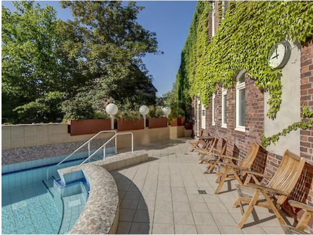
Die Sole-Außenbecken der Münster-Therme