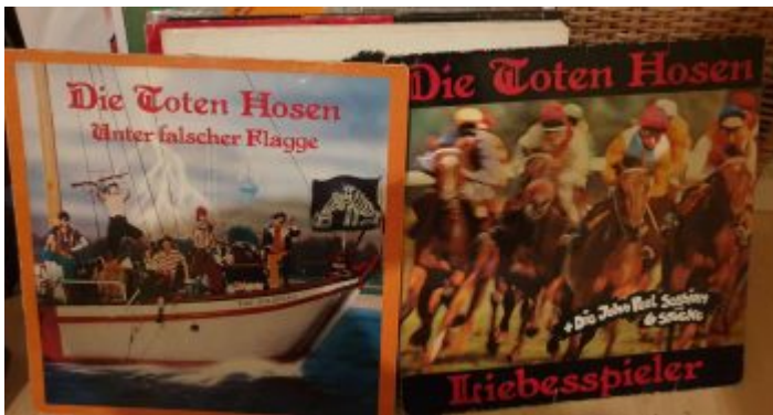
DTH „Unter falscher Flagge“ – Glampunk vom Feinsten

Ein guter Freund, übrigens ein Hosenhasser, sagt mal bei einer geselligen Runde vor ca. 15 Jahren einen sehr seltsamen Satz: „Eines der besten deutschen Glampunk-Alben ist die ‚Unter falsche Flagge‘ von den Hosen!“ Er sagte dies so eindeutig und selbstbewusst, dass keiner in der Runde auch nur ansatzweise Zweifel äußerte. Wir hatten gerade eigentlich über die ersten Platten von Pink Floyd gesprochen und hätten uns auch über Kochrezepte austauschen können, aber... hey, da passte das sicher trotzdem ganz gut. Irgendwie. Und auch wenn nicht, immerhin erinnere ich mich daran, als ich das Cover in den Händen halte. Was gab es damals ein Theater deswegen... ein skelettierter Köter vor einem Grammophon, der das EMI-Logo verulkt. Schön, dass es später mal ein Foto von Campino gab, der hockend vor einem alten Plattenabspielgerät saß. Ist Campi auch verklagt worden?