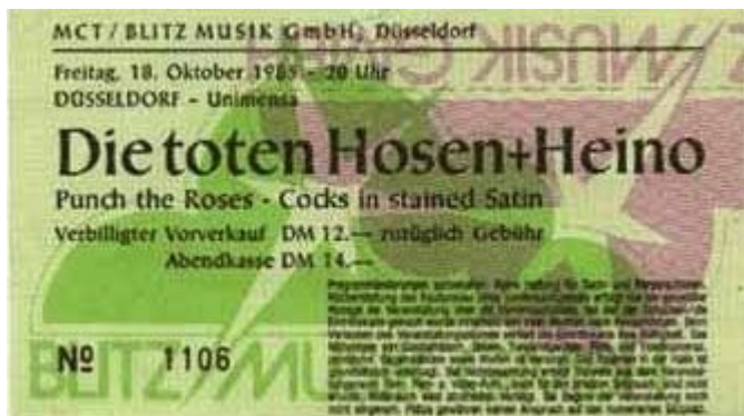
DTH+Heino - das Ticket

„Liebesspieler“, „Abt von Andechs“, „Shake hands“, „Sekt oder Selters“ oder „Warten nur dich“. Wobei letzteres eh nie meine Nummer war. Ich habe weder Streber gequält, noch musste ich vor irgendwelchen Leuten aus der Schule Angst haben. Gott sei Dank. Mobbing ist nämlich scheiße. Immer und überall. Egal, in welchem Alter. Aber... ja, das war schon ein verdammt gutes Album, Meine Favoriten: Im Hafen ist Endstation und Betrunknen im Dienst.