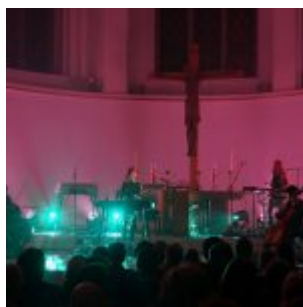
Johanneskirche - der passende Ort