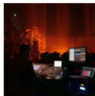
Die Technik für den guten Sound

Der frühe Durchbruch dürfte für Agnes Obel bis heute bittersüß schmecken, denn einerseits landet sie damit gleich zu Beginn ihrer Karriere einen beachtlichen, kommerziellen Erfolg. Andererseits ist sie in vielen Köpfen nun für alle Zeit das Mädchen mit dem niedlichen Telekom-Klimpersong und wird künstlerisch darauf festgenagelt. Geschadet hat es ihrer Anerkennung freilich nicht. Ihr Debütalbum „Philharmonics“, das im Herbst 2010 erschien, wurde in Dänemark mit 4-fach-Platin ausgezeichnet. Ihre nunmehr drei erschienen Platten finden eine treue Käuferschar, ihre Konzerte sind sehr häufig ausverkauft. Das gilt auch für ihre beiden Auftritte im Rahmen des New Fall Festival 2016 in Düsseldorf. Und das, obwohl die Tickets mit 45 bis zu rund 100 Euro nicht gerade zum Schnäppchenpreis angeboten wurden. Das Publikum in der schönen Johanneskirche ist bunt gemischt zwischen 20 und 60. Der eine oder andere mag über Rotwein, Kamin und Golden Retriever verfügen.