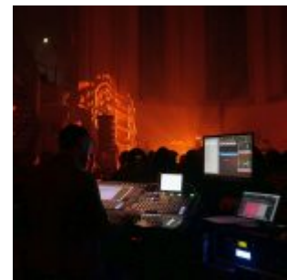
Die Technik für den guten Sound

Der frühe Durchbruch dürfte für Agnes Obel bis heute bittersüß schmecken, denn einerseits landet sie damit gleich zu Beginn ihrer Karriere einen beachtlichen, kommerziellen Erfolg. Andererseits ist sie in vielen Köpfen nun für alle Zeit das Mädchen mit dem niedlichen Telekom-Klimpersong und wird künstlerisch darauf festgenagelt. Geschadet hat es ihrer Anerkennung freilich nicht. Ihr Debütalbum „Philharmonics“, das im Herbst 2010 erschien, wurde in Dänemark mit 4-fach-Platin ausgezeichnet. Ihre nunmehr drei erschienen Platten finden eine treue Käuferschar, ihre Konzerte sind sehr häufig ausverkauft. Das gilt auch für ihre beiden Auftritte im Rahmen des New Fall Festival 2016 in Düsseldorf. Und das, obwohl die Tickets mit 45 bis zu rund 100 Euro nicht gerade zum Schnäppchenpreis angeboten wurden. Das Publikum in der schönen Johanneskirche ist bunt gemischt zwischen 20 und 60. Der eine oder andere mag über Rotwein, Kamin und Golden Retriever verfügen.