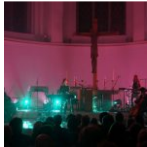
Johanneskirche - der passende Ort