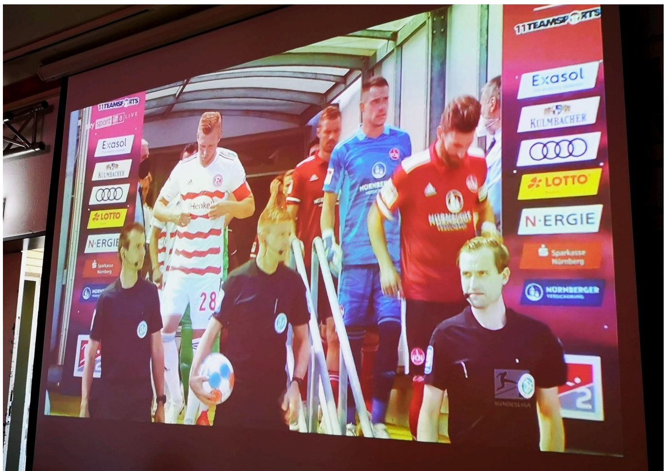
Nürnberg vs F95: Der Einmarsch in die Hitze