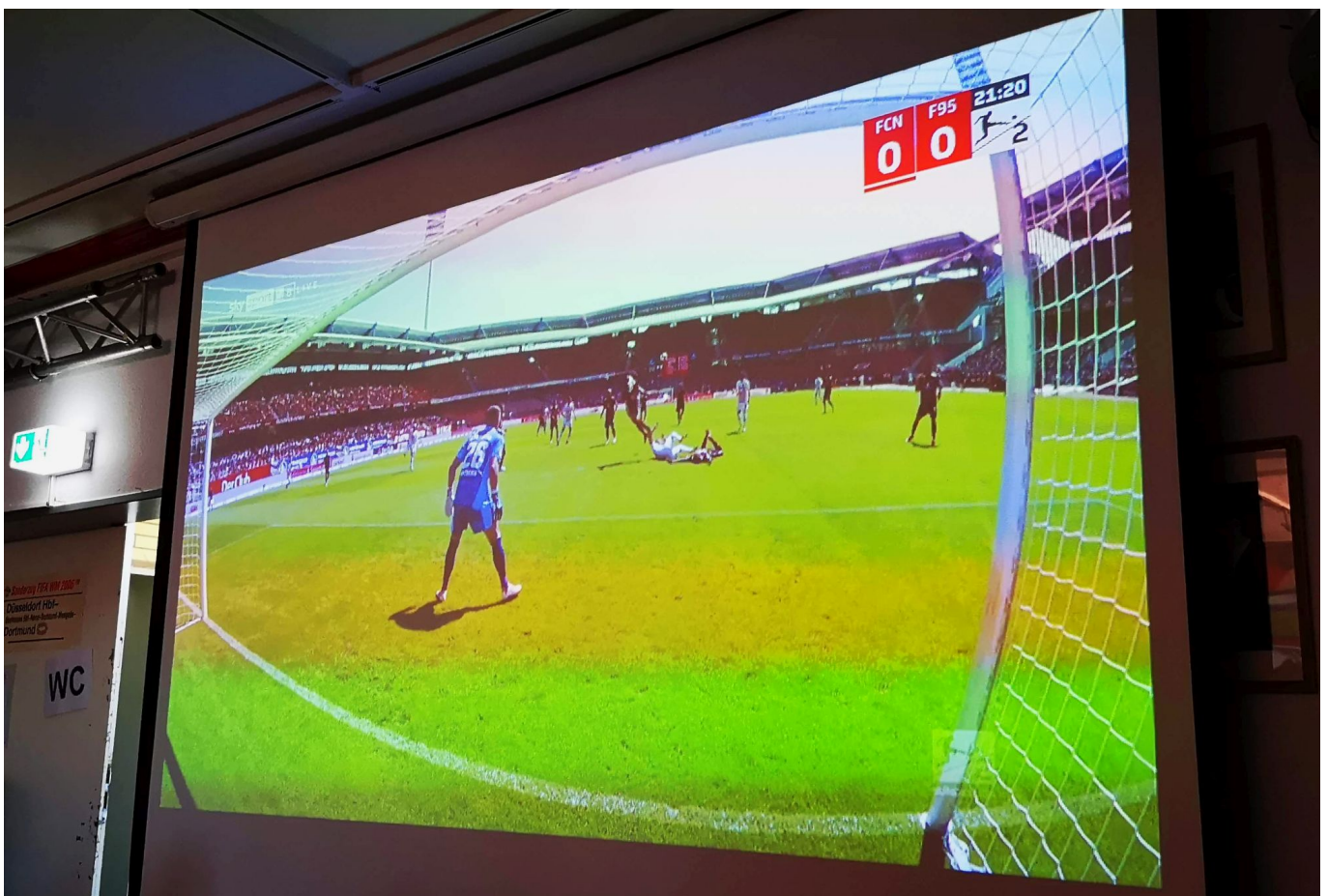
Nürnberg vs F95: Zweikampf im FCN-Strafraum – zu Recht kein Elfer

Sprechweise, bei der Verwendung der Fachbegriffe markieren sie absolut den modernen Stil des Trainerwesens. Dem einen oder anderen in Ehren ergrauten Fußballfanatiker wird das alles einfach zu gefühlsarm, zu geschäftsmäßig sein. Da fehlen die Ecken und Kanten, die unsere großen Trainertypen früherer Jahre immer hatten. Von Preußner wissen wir inzwischen (mitgeteilt von ungenannten Kaderinsassen), dass in ihm ein Vulkan brodelt, er aber die Lava seines Ärgers nicht einfach rauslässt – das fällt wohl unter den Begriff „professionell“.