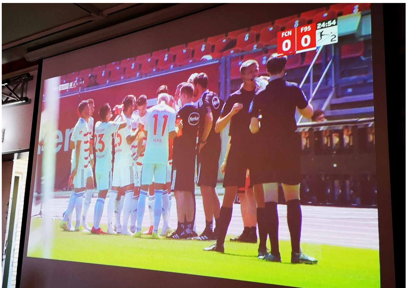
Nürnberg vs F95: Die dringend notwendige Trinkpause in der 25. Minute

nichts anbrennen – wie es in der 59. Minute zum Freistoßtor der Nürnberger kam, wird noch zu besprechen sein. Den Zorn der Glubb-Gemeinde zog sich Chris nach einem robusten Check gegen einen FCNler zu, bei dem das Opfer unsanft auf der Laufbahn direkt vor seinen Trainern landete. Das geschah in der 62. Minute, führte zu einer Rudelbildung, heftigen Wortgefechten zwischen Käpt'n Rouwen und Club-Betreuern und brachte Herrn Klarer eine (verdiente) gelbe Karte ein. Überhaupt: Am Ende standen 18 Fouls für Rotweiß an der Tafel, wobei viele davon unnötig waren, was auf einen Hauch Übermotivation schließen lässt. Trainer Preußner kritisierte das auch in der Pressekonferenz nach dem Spiel.