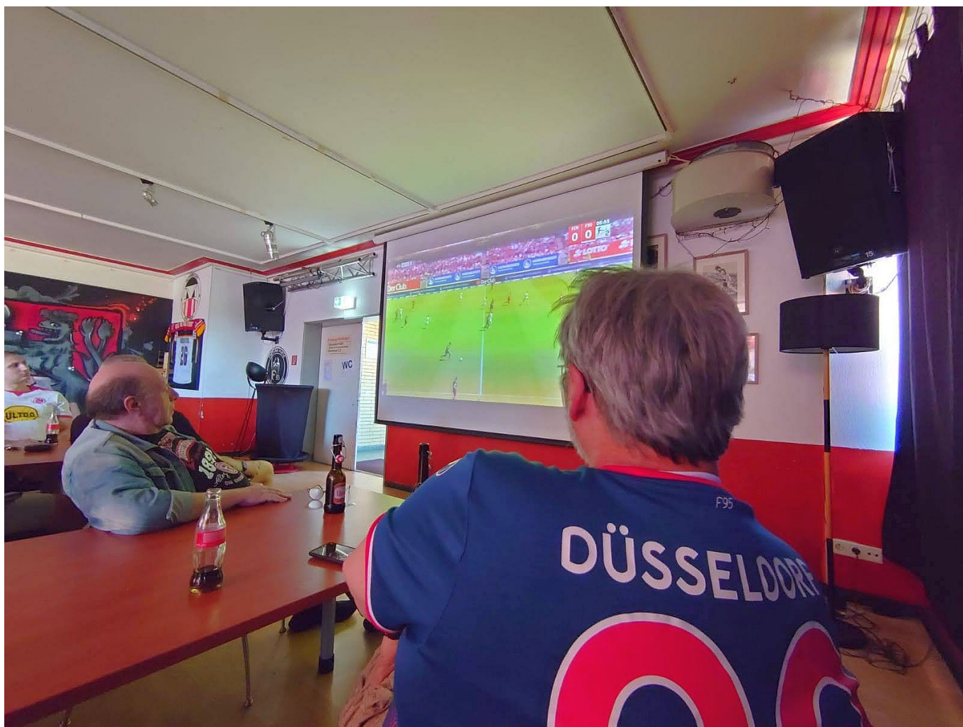
Nürnberg vs F95: Experterunde zu Gast bei den Ultras in der Bar95