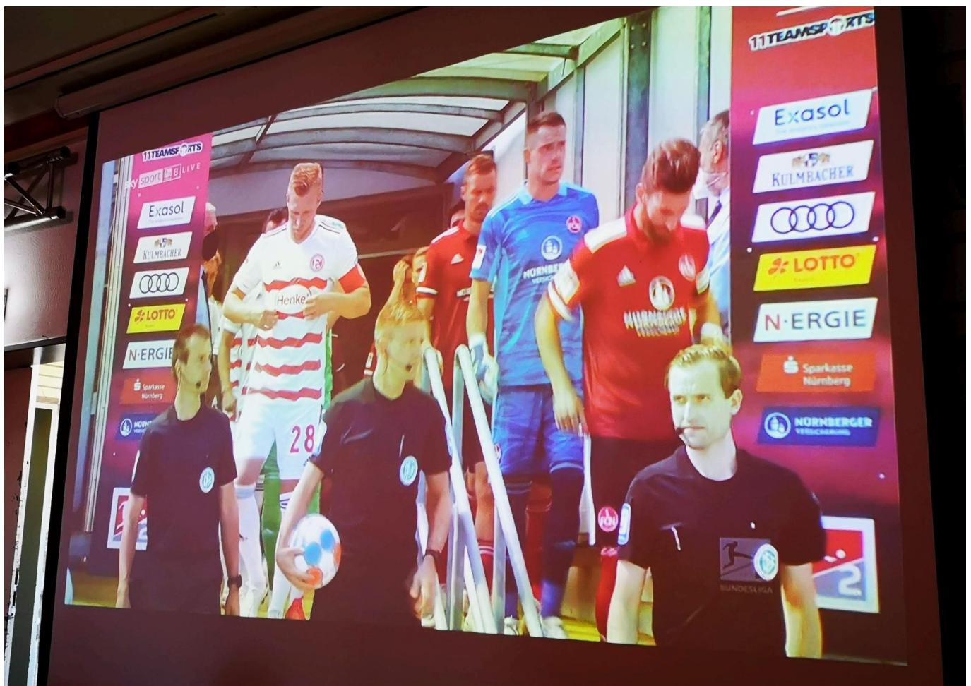
Nürnberg vs F95: Der Einmarsch in die Hitze