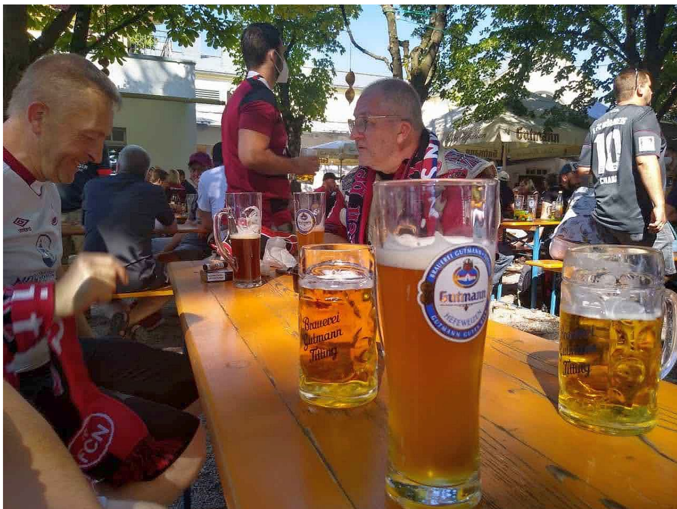
Nürnberg vs F95: Vorglühen der Auswärtsfahrer im Biergarten

Wie ähnlich Preußer und Klauß ihre Arbeit auffassen, war jederzeit mit den Händen zu greifen. Die grundsätzliche Spielanlage des FCN und der glorreichen Fortuna in der laufenden Saison ist verblüffend ähnlich, der Hang zur Flexibilität auch. Ja, zwischenzeitlich (ca. Minute 25 bis 40) kopierten die Clubberer praktisch den fortunistischen Ansatz. Damit konnten die Herren um Käpt'n Hennings eigentlich nie so richtig etwas anfangen. Hauptunterschied zwischen den Teams: Während bei F95 fast alle Offensivaktionen über die Flügel liefen, kam der FCN öfter durch die Mitte. Weil die Teams aber schon im Mittelfeld und erst Recht in der jeweiligen Viererkette bombenfest standen, waren Torchancen Mangelware.