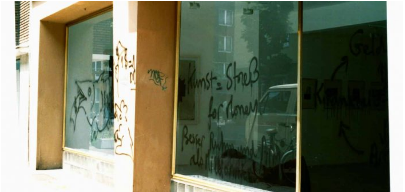
Hatespeech, 1992 am 1. Düsseldorfer Standort Kirchfeldstraße, die der Sprayer später selbst entfernte

„Man muß eine Menge an Einsicht gewinnen, um eine Vorstellung davon zu entwickeln, was in einer Galerie erfolgreich gezeigt werden kann. Zu dieser Ein- oder Innensicht in die Kunst gehört auch, dass wir immer nur aus dem Galerieprogramm heraus verkauft haben.“ Kunst könne natürlich auch als Ware an Märkten Absatz finden, auch mit hohen Gewinnen, sie komme aber und vor allem erst dann zu Wert, wenn jemand sich die Mühe mache, Wesentliches zu verstehen, zu entdecken und zu vermitteln. Wer in der Lage sei, dies zu verdichten, der brauche Kunden nicht zu bearbeiten. Ein überzeugendes Angebot reicht. „Und am Besten ist, du musst gar nichts sagen. Nur zeigen.“