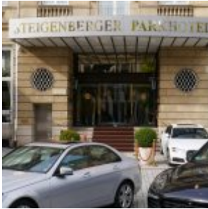
Das Steigenberger Parkhotel