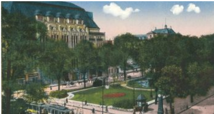
Der Corneliusplatz auf einer zeitgenössischen Ansichtskarte von 1909

Süd-Richtung umgesetzt. Die eine hieß später Alleestraße und führte bis zur Brücke ins Linksrheinische, damals noch eine Schiffbrücke, bei der die Fahrbahn auf einer Reihe Boote lag, die durchfahrenden Kähnen bei Bedarf Platz machten. Dieser Boulevard wurde 1963 in Heinrich-Heine-Allee umbenannt. Der andere Boulevard erhielt den Namen Kastanienallee und wurde später zu Ehren des schwer beleidigten preußischen Königs zur Königsallee.