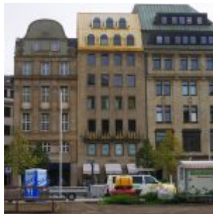
Die Westseite des Platzes