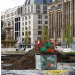
Blick über die Baustelle (Oktober 2017)