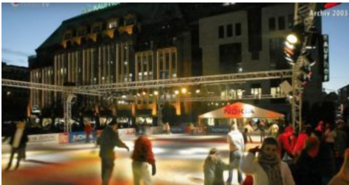
2003: Der letzte Winter vor der Baustelle

Der Umbau der Königsallee zur Prachtstraße ist aufs Engste verbunden mit dem Bau des Warenhauses Tietz, dem heutigen Kaufhof an der Kö, in den Jahre 1907 bis 1909. Da gab es den Corneliusplatz als Erweiterung des Hofgartens bereits. 1882 hatte man den neobarocken, von Leo Müsch gestalteten Schalenbrunnen aufgestellt. Der Stadtgärtner Friedrich Hillebrecht hatte die zugehörige Grünanlage entworfen und anlegen lassen. Wann genau die berühmte „Grüne Mathilde“, eine schlanke Normaluhr, am Corneliusplatz aufgestellt wurde, lässt sich nicht mehr ermitteln. Auch das Jahr, in dem der ebenso legendäre Kiosk aufgebaut wurde, ist unklar. Beides dürfte aber noch vor dem ersten Weltkrieg stattgefunden haben.