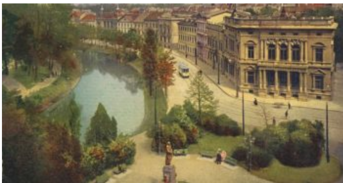
Blick über den Platz zum Kö-Bogen (vor dem 1. Weltkrieg)

Benannt ist der Platz nach dem berühmten Düsseldorfer Maler Peter (von) Cornelius , einem ächten Düsseldorfer Jong, geboren auf der Kurze Straße, dessen Vater ebenfalls Maler und Dozent an der Akademie war. Cornelius war der bedeutendste Vertreter der Nazarener und Bewunderer Goethes , der ja bekanntlich nicht selten in Düsseldorf bei den Jacobis zu Besuch war. Apropos Goethe: Der berichtete in einem Brief von einem Spaziergang durch die Vororte der Stadt, genauer: von der Villa der Jacobis (heute steht dort der Malkasten) wanderte er durch das, was heute der Hofgarten ist, in Richtung Ratinger Tor und machte ungefähr da, wo heute der Kö-Bogen an den Corneliusplatz stößt, Rast unter einem schattenspendenden Baum.