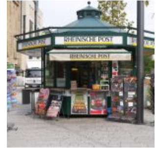
Der berühmte Kiosk, jetzt auf der anderen Seite