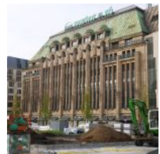
Der Kaufhof an der Kö