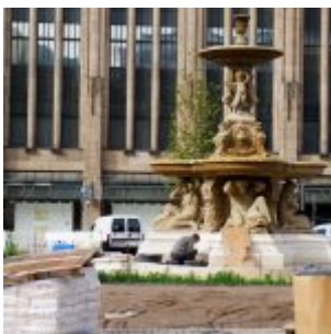
Schalenbrunnen vor dem Kaufhof