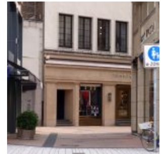
Das Stückchen Blumenstraße am Platz