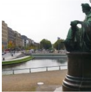
Blick vorbei am Corneliusdenkmal