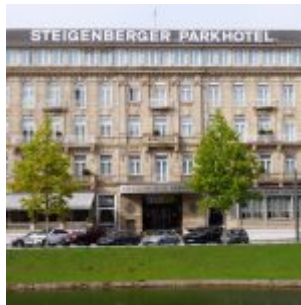
Das weltberühmte Parkhotel

Wer erst nach 2006 nach Düsseldorf gekommen ist, kennt dieses besondere Schmuckstück nicht. Denn der Corneliusplatz war das ärmste Opfer der Bauarbeiten rund um die Wehrhahn-Linie und den Kö-Bogen. Mehr als 10 Jahre lang diente die Fläche zwischen dem Ende der Kö, dem Kaufhof und dem Hofgarten in irgendeiner Form als Lagerplatz und Grundstück für die Bau-Container. Schlimmer noch: Über mehrere Jahre verunzierte eine massive Werbefläche nicht nur den Platz, sondern den gesamten nördlichen Bereich der Königsallee. Aber jetzt ist das Leiden bald vorbei, der Corneliusplatz soll wieder in alter Schönheit auferstehen. Mit dem Aufstellen des berühmten Schalenbrunnens hat die Auferstehung in diesen Wochen begonnen.