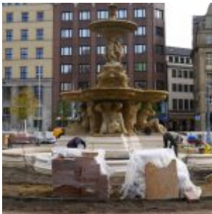
Der Schalenbrunnen in Arbeit