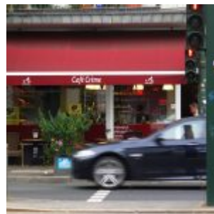
Café Creme an der Ecke