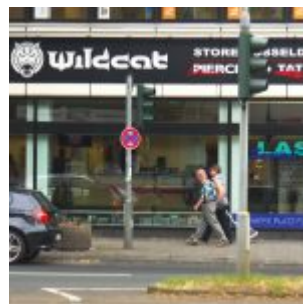
Piercing in der Bankfiliale