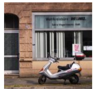
Die Linke samt Sahara