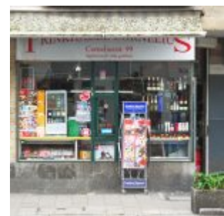
Das andere Büdchen