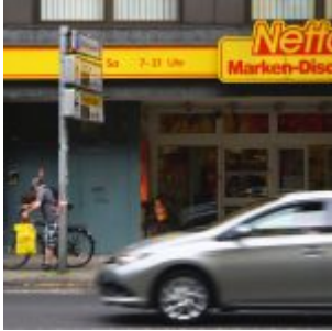
Netto, alles billig