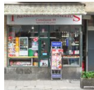
Das andere Büdchen