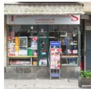
Das andere Büdchen