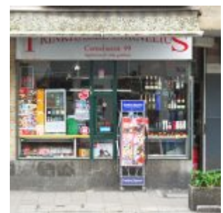
Das andere Büdchen