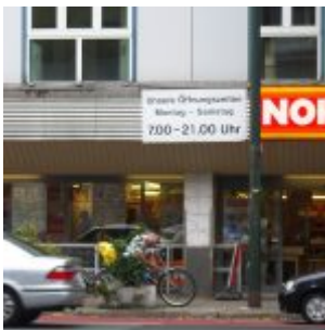
Norma, alles billig