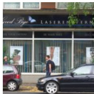
Haar- und Tattoo-frei