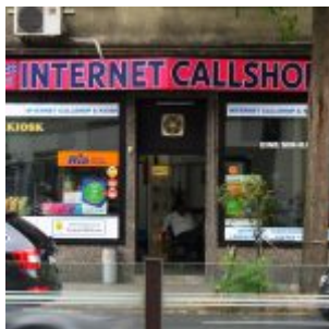
Internet-Cafe - lebt noch