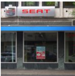
Ein bisschen Seat