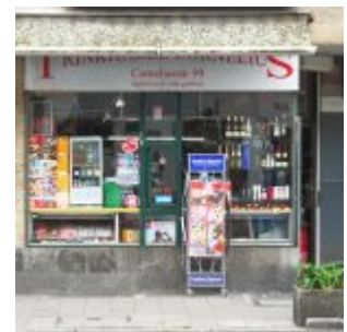
Das andere Büdchen