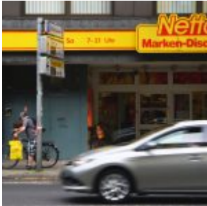
Netto, alles billig