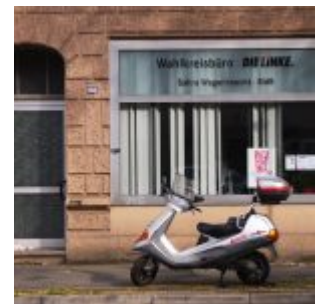
Die Linke samt Sahara