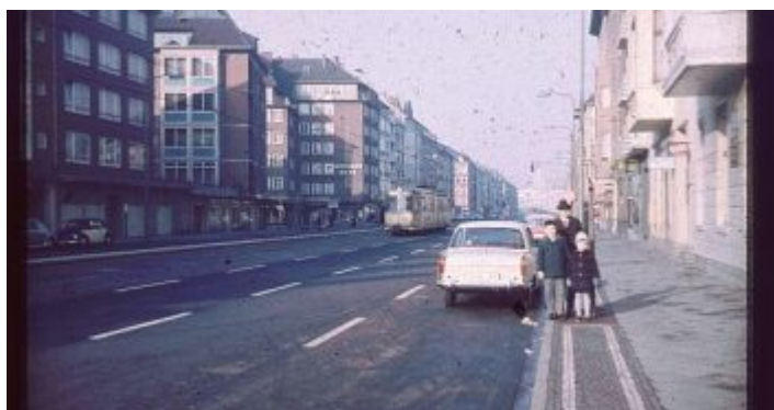
Corneliusstraße ca. 1960

In der hier veröffentlichten Geschichte „Mit nem Ei im Mund“ habe ich eine Reihe Erinnerungen an die Corneliusstraße der späten Fünfziger- und Sechzigerjahre verarbeitet. Inzwischen sind mir weitere Details eingefallen. An der Ecke zur Oberbilker Allee (Richtung Innenstadt links) residiert heute ein Café-Bar der Firma Espresso Perfetto. Witzigerweise war der erste Ladenmieter die längst vergessene Kaffee-Kette „Überseekaffee“, wo unsere Mutter den Kaffee einkaufte. Auf dem Weg in die Volksschule an der Kirchfeldstraße wechselten wir hier die Straßenseite. Und kamen am Schreibwarenladen vorbei, dessen Namen ich leider vergessen habe. Dort versorgten wir uns nicht nur mit allem, was man so für die Schule brauchte, sondern auch allerlei Spielkram. Zum Beispiel fanden wir hier die mit Abstand größte Auswahl an Murmeln, die Düsseldorf „Dötze“ nennt. Gedötzt wurde nachmittags extensiv unter den Bäumen am Fürstenplatz.