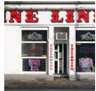
Fine Line, der erste Tätowierladen hier