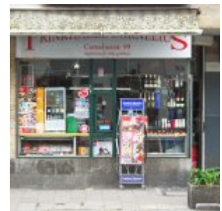
Das andere Büdchen