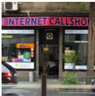
Internet-Cafe - lebt noch